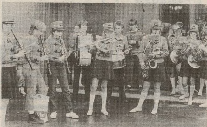
Stranden skolekorps spilte på Flateby samfunnshus lørdag.

Med denne innsatsen og visshet om 14 aspiranter og det samme antall notekuselever, ser Ytre Enebakk skolemusikkorps lyst på fremtiden.