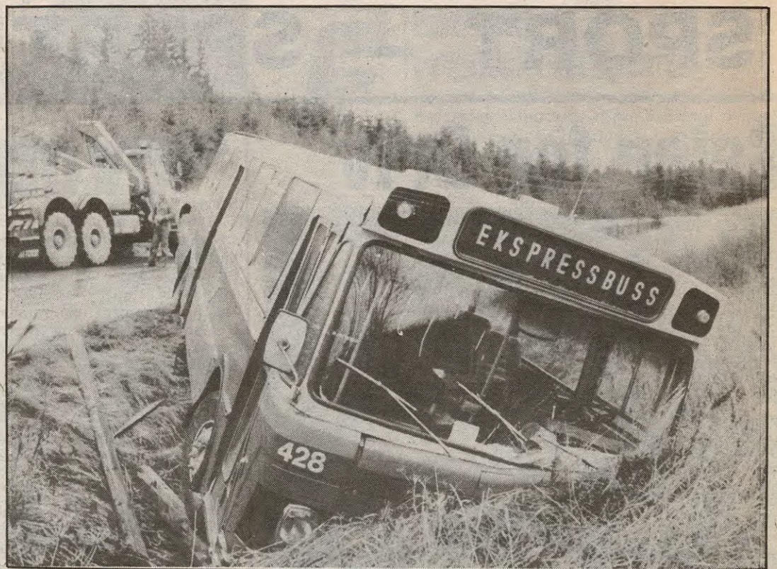
Det er ikke lenger sommerføre

—Er enig i at det ofte er dårlig stødd og brøyta mellom Flateby og Sværsvann. Likevel kan ikke disse skyldes på i dette tilfellet. Regnværet gjorde at det dårlige føret kom så fort. De kunne umulig være der akkurat når det skjedde.