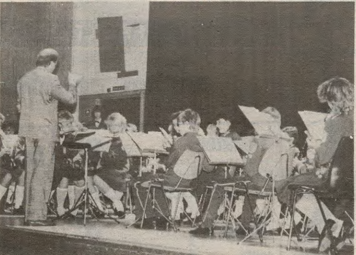
Ytre Enebakk skolekorps gjorde det over all forventning i søndagens vurderingskonkurranse i Kolbotn Kino.

Foruten vertskapet var Stranden skolemusikkorps invitert. Dette er kommunens eneste 1. divisjonskorps som utførte en imponerende konsert med stor presisjon.