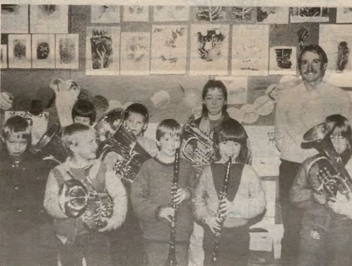
Nye, energiske krefter er kommet til i Enebakk skolemusikkorps.

—Herlig, jeg fikk tuba! Klarinett var akkurat det jeg ville ha. Dette er noen av utbruddene som hørtes da notekurselevne i Enebakkskolemusikkorps fikk instrumenter. Iveren var stor etter å komme i gang med øvelsen. Trolig vil vi snart høre mer fra de nye musikanter.