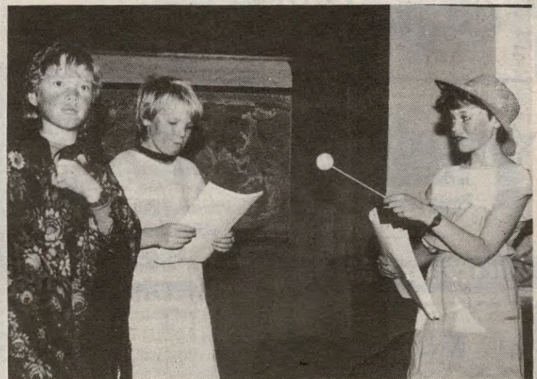
Underholdningsgruppa hadde laget en nyhetssending med stor bredde i det redaksjonelle stoff.

Lærere på Stranden Barne-skole vurderer etter temadagen fredag, å la være å arrangere fellessamlinger for hele skolen før de får ny gymsal. De er lei av at timer med arbeid blir ødelagt på