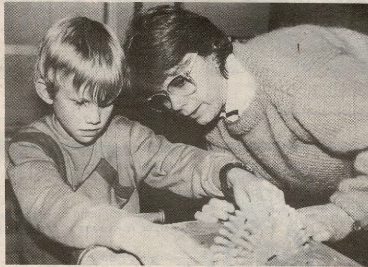
Stor iver på arbeidsstua i Kirkebygda.

Klype på klype møysommelig satt sammen til serviettholdere. Stor konsentrasjon og masse skaperglede ble vist på sløyden tirsdag kveld. Da var det arbeidsstue for de mellom 6 og 10.