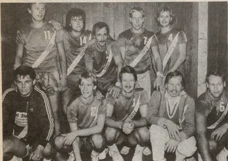
Det ble seier for Drivs håndballgutter søndag.

Søndag spilte Drivs herrelag i håndball femtedivisjonskamp mot Ammerud i Mjærhallen. Sluttresultatet ble 19-14, men seieren satt ikke så godt inne som seieren skulle tilsi.