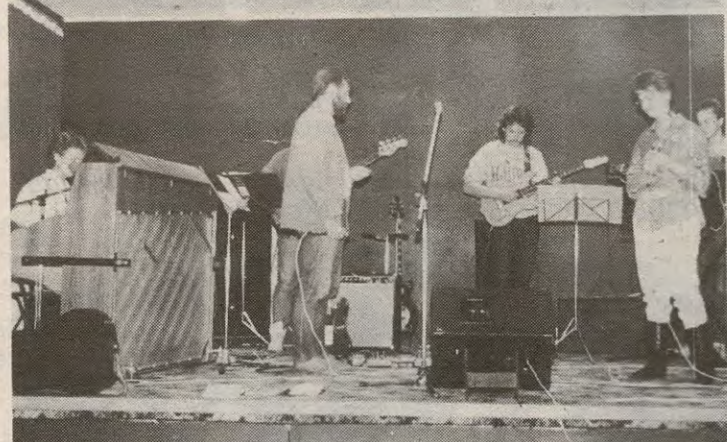
Lørdag var det gospelkveld på Mjær.