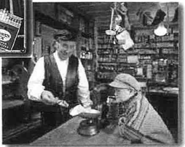
Motiv fra butikken