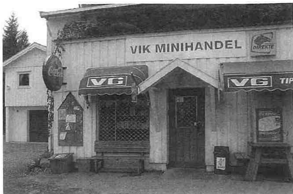
No er namnet Vik Minihandel.