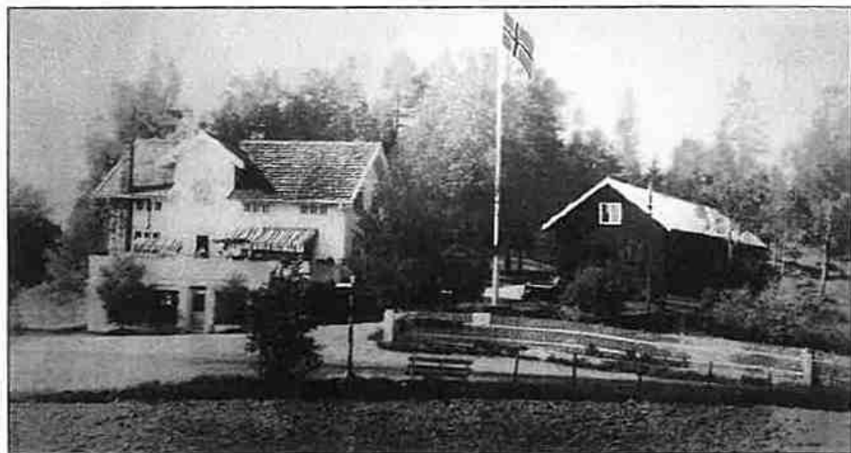
Vangli landhandleri i Vik-svingen.