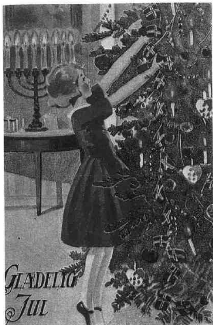
Pynting av juletre var også et mye brukt motiv på julekortene. Dette kortet er fra samlingen på Norsk Folkemuseum.