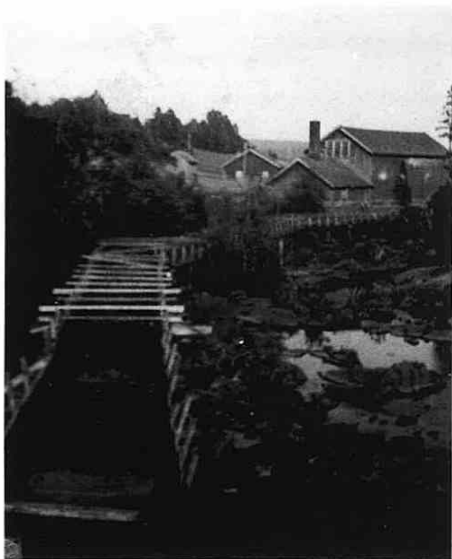
Enebakk mølle, sett fra Vestbybrua. Bildet er tatt ca. 1930