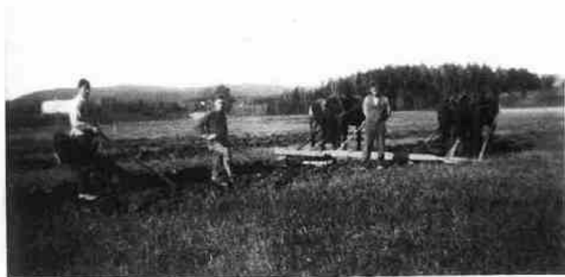
Grøfting med grøfteplog på Krogsbøl i 1930-årene