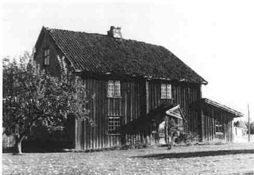
Den gamle hovedbygningen på Brevig i Ytterbygda. Dette flotte huset er nå dessverre revet.

En bevaringsverdig bygning kan ha ulike kvaliteter som verdsettes. Et av de viktigste kriteriene for vern er alder og det som kalles autentisitet. Autentisitet er et begrep som sier noe om hvor mye som er bevart av bygningsdeler fra huset var nytt, eller fra en tidlig ombygningsfase. Så har vi estetisk og arkitektonisk verdi, pedagogisk egnethet (kan objektet benyttes i undervisningsøyemed?). En bygning kan ha begrenset verdi i seg selv, men være viktig i en større sammenheng (miljøverdi) Eksempel på dette kan være et hus i en husrekke med i utgangspunktet like bygninger, men der ett hus har gjennomgått visse endringer. Det endrete huset har redusert verdi isolert sett, men er fortsatt viktig i husrekken, og kan tilbakeføres til det opprinnelige dersom det er ønskelig.