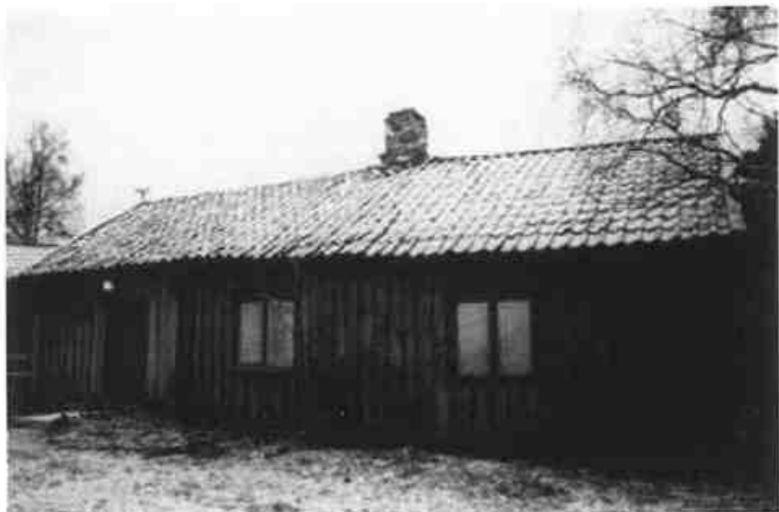
Husmannsplassen Lemestad i Kirkebygda, fotografert i 1985. Bygningen er nå revet.

Enebakk er den siste kommunen i Follo og en av de siste på Romerike som starter arbeidet med en kulturminneplan. Hva tror du dette skyldes?