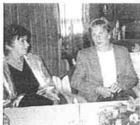
Liv, Rind og Trigen, Gledson