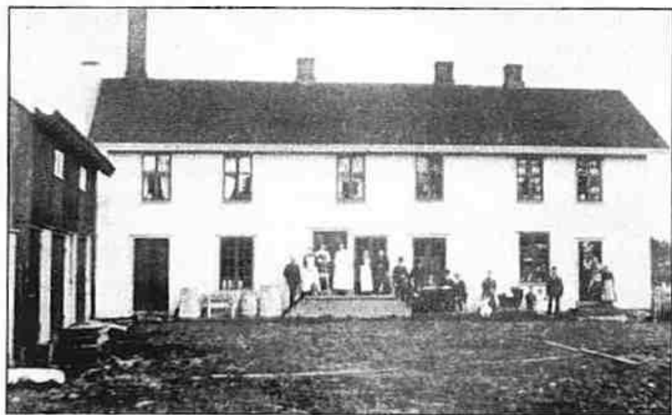
Enebakk Aktiemeieri før krigen.

Staten hadde kjøpeplikt på norsk korn. Det var ønskelig at eget korn skulle nyttes som fôr på garden. Fra 1927 var det slutt på statsmonopolet på kornimporten, men stønaden til det norske kornet fortsatt i statens regi. Dessuten ble det gjennomført korntrygd. Det ville si at kornprodusentene fikk utbetalt stønad for et visst kvantum korn til eget bruk. Møllene som malte kornet ga kvitteringer for innveid korn, noe som igjen var utgangspunktet for utbetalt korntrygd.