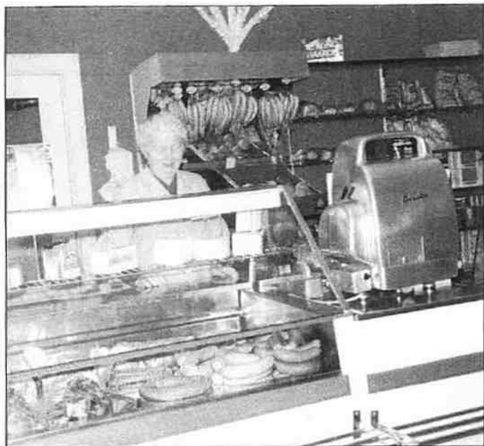
Borghild Bakke i ferskvareavdelingen på Kirkeby. Som vi ser er utvalget av pølser og ferskt kjøtt bra. Dekorasjonen tyder på at vi befinner oss ved juletider

var det opp i bingen for å hente isblokker som ble brukt til å kjøle vann i en stor vannkum, for oppbevaring av for eksempel melke (samme type melkekjøling var det også på gårdene langt ut på 1950-tallet).