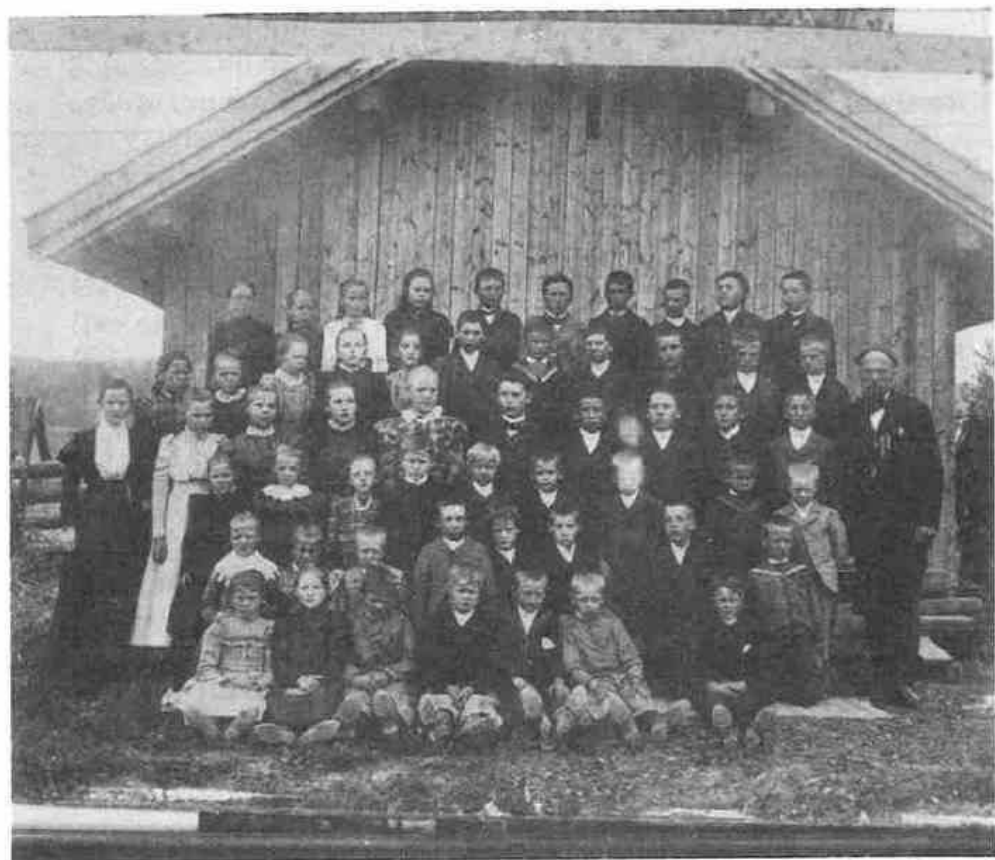
Skolebilde fra Dalefjerdings 1998