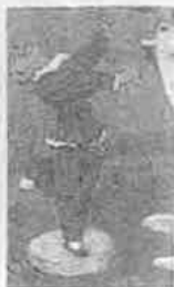
Enger, Erling. Et lite maleri. 1930. 10 x 10 cm.