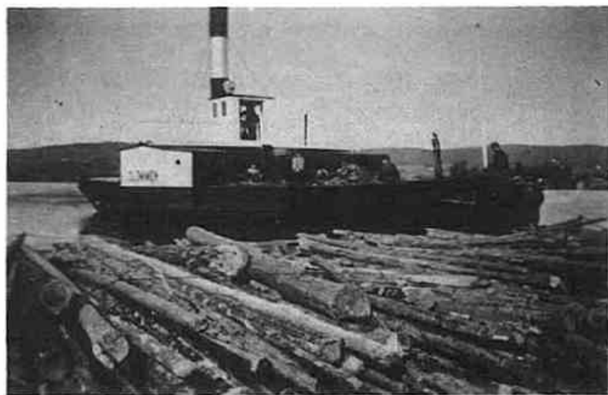
Dette er en annen tømmerbåt: "Glommen"