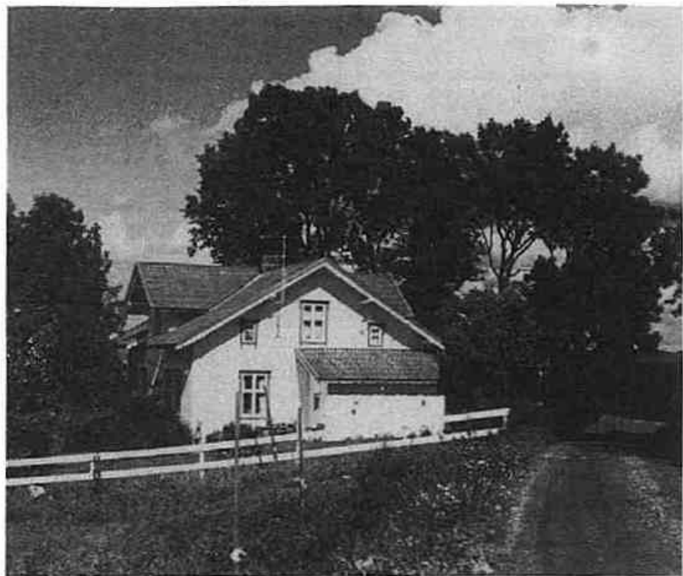
Bygningen på Store-Hvitstein