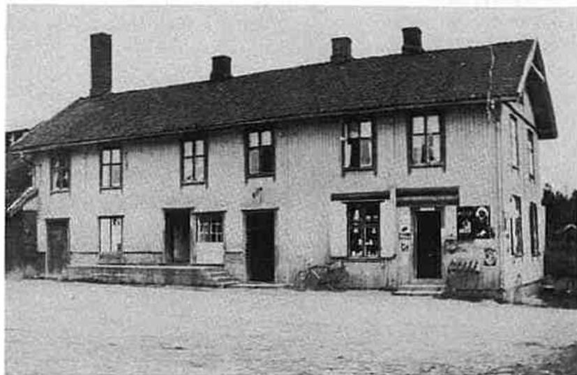
Enebakk Aktiemeieri A/S ble lagt ned i 1951.