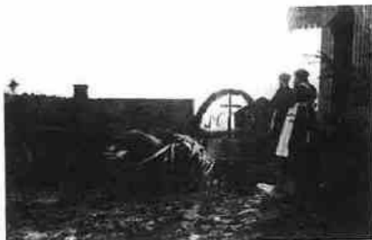
Fra en begravelse på Østby i Ytterbygda i 1920-årene.

Noen av testamentene er oppretta i svært dramatiske situasjoner, på sykeleiet eller dødsleiet. I disse tilfellene gis det ofte en beretning som er svært rik på informasjon om testators nettverk, om naboer og familie som var til stede på dødsleiet.