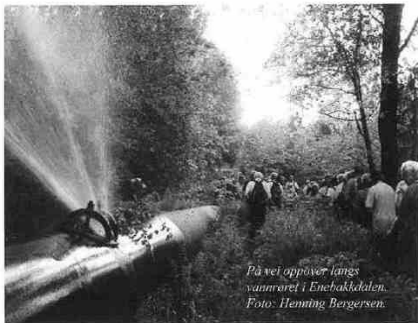
På vei oppover langs vannvoret i Enebakkdalen.