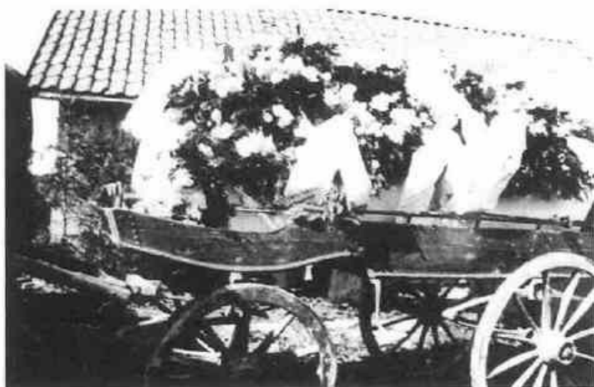
Båre på Nordre Randem i 1922.

Eldreomsorg er et brennbart politisk tema, spesielt i valgår. Men at det offentlige har ansvar for pleietjenester i alderdommen, er historisk sett et nytt fenomen. Tidligere ble de gamles behov hovedsaklig dekket ved føderådsavtaler og kårordning. Slike ordninger er fremdeles godt kjent på bygdene i Norge, selv om innholdet i føderådsavtalene har endret seg mye. Tidligere omfattet avtalene gjerne hus og brensel, mat og klær. Avtaler ble som oftest inngått mellom foreldre og barn. Men hva med dem som ikke hadde barn? I denne artikkelen skal vi se på hvordan testamenter kunne fungere som avtaler om eldreomsorg for eldre barnløse på 1800-tallet. På Ringerike finnes uttrykket "å testamentere seg inn" på en gård. Gamle folk som ikke hadde slektninger, kunne skaffe seg pleie og omsorg i alderdommen ved å inngå en avtale med en gårdsfamilie. Hvis den gamle fikk god behandling og var fornøyd, var avtalen at folket på gården arvet den gamle. Noen avtaler ble utformet som testamenter og underskrevet av den gamle – testatoren – og arvingen. I dag finnes disse testamentene ved Riksarkivet i Oslo.