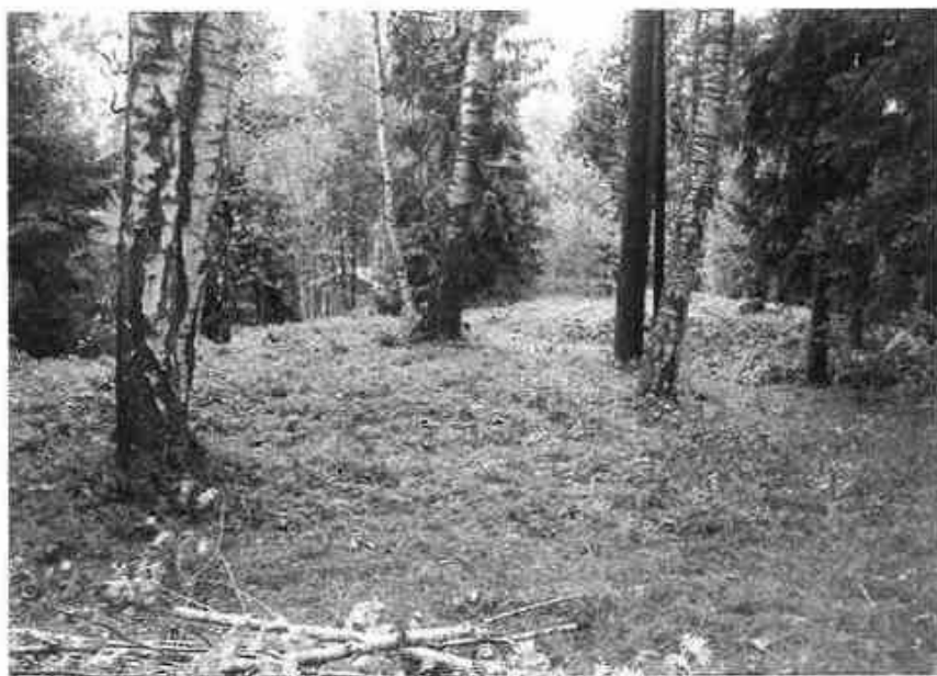
Bjerkehaugen i Ytre Enebakk er nå blitt "adoptert" av en 5. klasse ved Ytre Enebakk skole. Elevene skal lære om kulturminnet og den perioden det stammer fra. I tillegg skal elevene rydde og ta vare på kulturminnet.

Denne våren startet et nytt samarbeidsprosjekt mellom Ytre Enebakk skole, Akershus fylkeskommune, Kulturtjenesten i Enebakk kommune og skolegruppa i Enebakk historielag. Dette prosjektet inngår som en del av "den kulturelle skolesekken" og Enebakk er den andre kommunen i landet (etter Ski kommune) som går i gang med kulturminneadopsjon. En av 5. klassene på Ytre Enebakk skole skal sette i stand kulturminnet på Bjerkehaugen - et gravfelt fra jernalderen. Elevene skal gjøre seg kjent med gravfeltet og være med å rydde området. Målet er å øke elevenes kunnskap og interesse for kulturminner. Dette prosjektet fortsetter neste skoleår, som et samarbeid mellom skolen, kommunen, historielaget og fylkeskommunen.