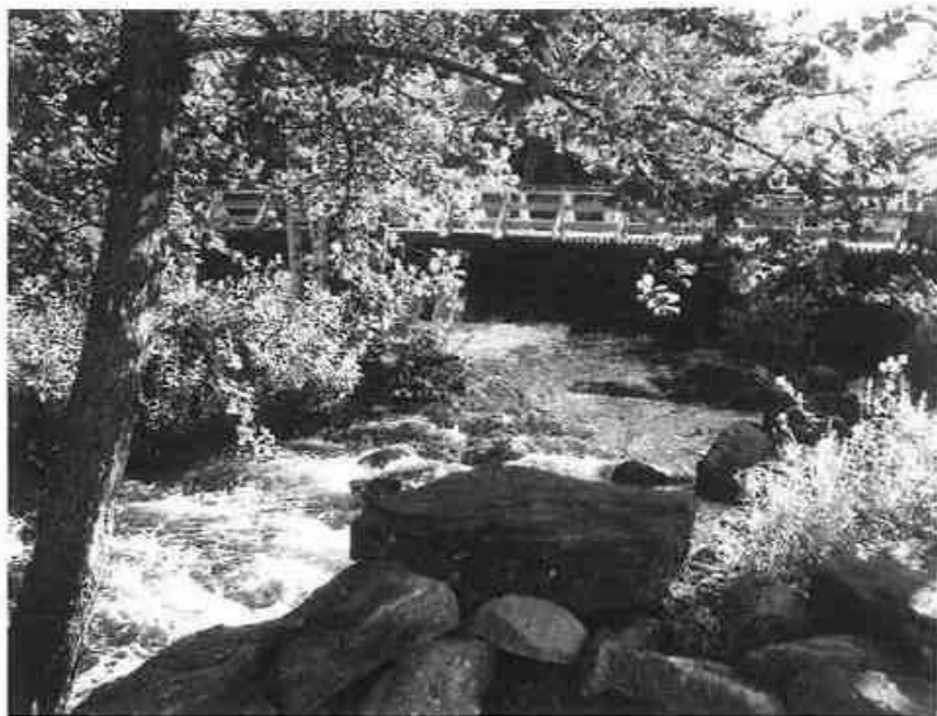
Sommeridyll ved Sagstudammen i Ytterbygda.