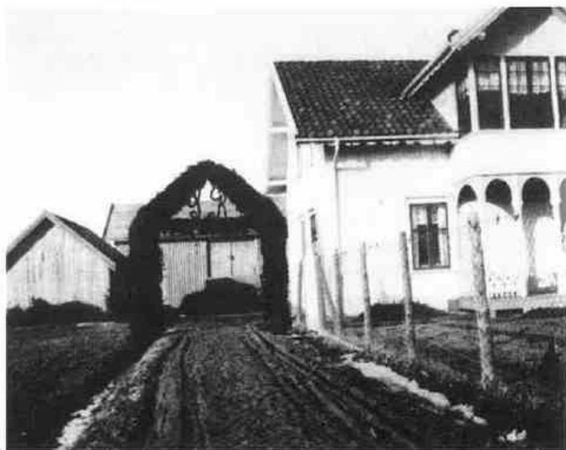
Nordre Randem pyntet til begravelse.

Testamenter kan være spennende kilder fordi de gir så mye informasjon. Vi kan få opplysninger om arvelateren og arvingenes navn, bosted og om det personlige forholdet mellom dem. Testamentene gir også opplysninger om arvelaterens økonomiske stilling, hva arven består i, og om testator eller vitner var skriveføre eller måtte undertegne med påholden penn.