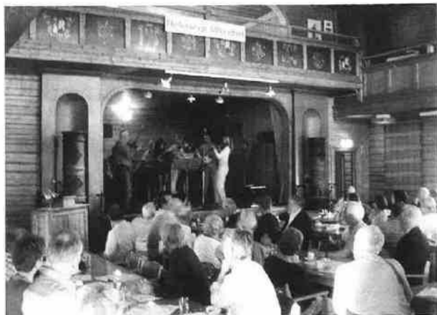
Enebakk spellemannslag sørget for god stemning under årsmøtet.