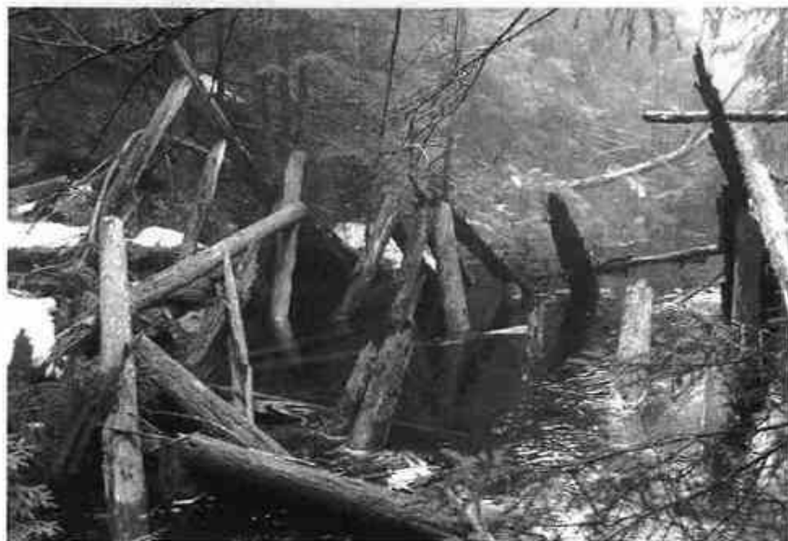
Det finnes forisatt rester etter den store tømmerdemningen ved Stordammen. (Red.)

I området innenfor Haugstein gård var det for 100 år siden nesten en hel grend! Damsåa har i lang tid vært viktig som kraftkilde for sagene og seinere for cellulosefabrikken ved Øyeren. Den delen av vassdraget som går mellom Haugstein og Sundby passerer tre tjern (Merratjern, Stordammen og Påstranda) som alle var regulert med svære tømmerdemninger for å skaffe nok vann til turbinene på fabrikken.