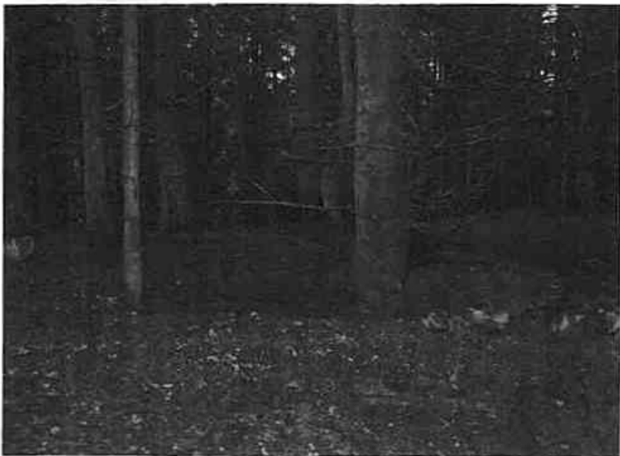
Dypt inne i den tette granskogen finner man tuffene etter den gamle plassen Stubberud. (Red.)

Å være budeie på Fageråssetra var nok et slit langt unna folk med noe melking og kanskje kinning av smør, men du verden for et flott sted å våkne opp en stille sommermorgen! Rester etter fjøset fant jeg en vårdag i 1983, da jeg under planting kom over en tue med brennesle og fant små nedraste steinrøyser som et hus hadde stått på. Kanskje var det den gamle utedoen som fortsatt ga næring til brenneslen?