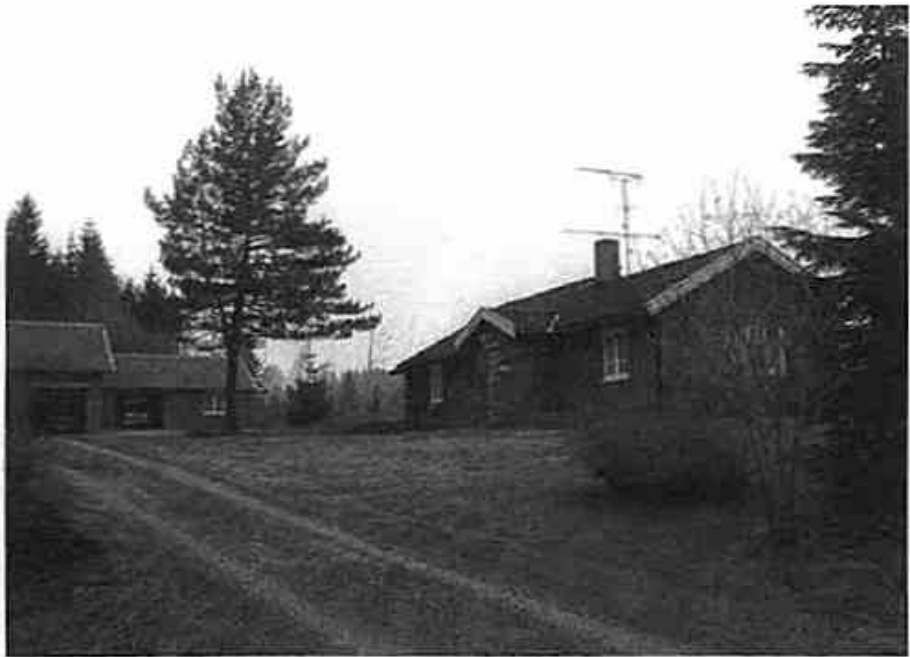
Plassen Langli slik den fremstår i dag. Det er lite som kan minne om den forlatte og forfalne hytta man kan se i filmen "Ung flukt".

Den skoleflinke og streite Anders har tatt med seg den skakkjorte ungjenta Gerd ut på landet for å få henne vekk fra byen og gjengen hun vanker i. Anders er oppriktig glad i Gerd og vil redde henne fra det ville livet hun lever. Gerd er bare 17 år, men allerede på "skråplanet". At Gerd er født utenfor ekteskap av en "lettsindig" mor har ikke gjort livet lett for henne: hun har i flere år vært i sosialvesenets varetekt. En tid lever de to unge alene på den forlatte husmannsplassen, stort sett på luft og kjærlighet. Sulten setter etterhvert inn og de bestemmer seg for å ta livet av en av sauene som trækker rundt i skogen. I det øyeblikket Gerd løfter kniven til hogg for å slakte dyret, dukker imidlertid fanten Bendik opp fra skogkanten med en hagle i hånden. Bendik er en tidligere straffange og med sitt mystiske vesen vekker han snart Gerds interesse.