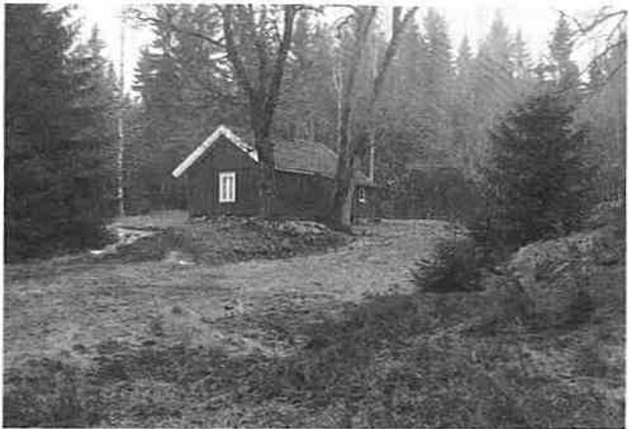
Dammen er i dag en av de få plassene inne på Flatebyskauen som fortsatt står. Artikkelforfatteren har selv restaurert den gamle husmannsplassen, som i dag fremstår som en av de best bevarte stuen i hele Enebakk. (Red.)