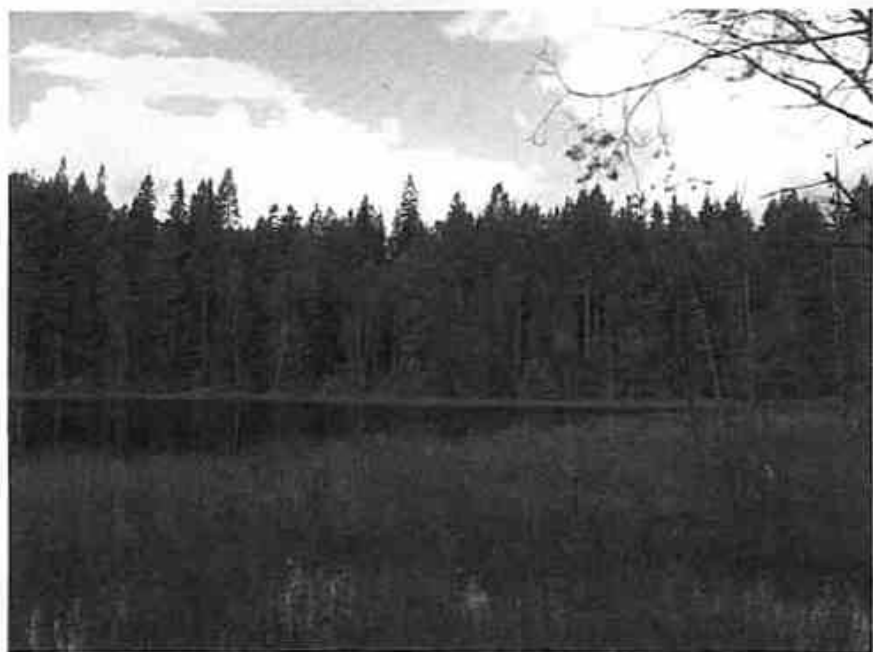
Merratjern innenfor gården Haugstein på Stranda. Dette tjernet var tidligere demmet opp og dermed med på å forsyne Flateby Cellulosefabrikk og sagbrukene nedover langs vassdraget med kraft. (Red.)

Jeg husker for noen år siden at jeg traff en kar innpå skauen som synfarte det nye kartet for Enebakk og som akkurat var ferdig med samme jobben i Fet. Han var forundret over hvor mange flere rester etter boplasser han fant i denne delen av Østmarka. Går vi 100 – 150 år tilbake i tid var det et helt annet liv i skogen enn i dag. Den gang ga skogen og marka livsopphold til mange mennesker på mindre plasser i skogen. Det var et yrende liv av husdyr på beite, lekende barn og folk som hadde sitt daglige virke i skogen. Mange livnærte seg som håndverkere og tok seg jobber nede i bygda, men hadde ei ku, noen griser, geit eller sau på plassen sin. Skogen ga mat i form av vilt, bær og fisk, beite til dyrene, ved og materialer til gjerder og hus.