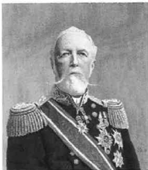
Oscar II - Sveriges og Norges konge frem til unionsoppløsningen. Kong Oscar var 76 år gammel i 1905 og svært syk. Han døde i 1907.

Dette ble imidlertid en svært løs union. De to rikene skulle riktignok ha samme konge og felles utenriksstyre, men Norge beholdt sin nye grunnlov og fikk fullt indre selvstyre. I tiden etter 1890 vokste det frem en sterk demokratisk og venstreorientert nasjonalisme i Norge og dette resulterte i flere større konflikter med unionspartneren Sverige. Partiet Venstre krevde et eget norsk utenriksstyre, i første omgang egne norske konsuler. I Sverige blusset det opp en høyreorientert nasjonalisme som ønsket å markere svensk overhøyhet i unionen. Disse konfliktene førte til flere kriser utover i 1890-årene. Etter 1895 mistet tilhengerne av unionen de fleste argumentene av økonomisk art, da den svenske riksdagen sa opp de såkalte mellomrikslovene, som hadde gjort de to landene til et slags frihandelsområde.