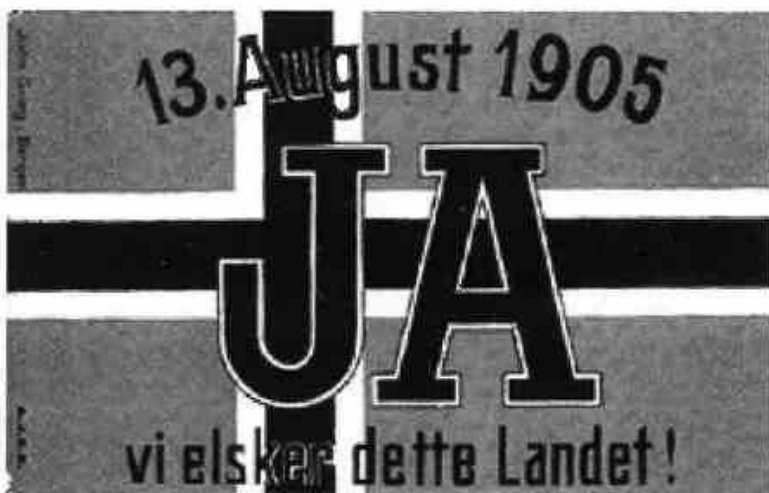
Postkort med det norske flagget fra august 1905. Utviklet en sterk oppfordring til å stemme Ja til unionsoppløsningen.

Den svenske Riksdagen kom sammen til ekstraordinær sesjon og nedsatte en spesialkomité. Konklusjonen var at Sverige i prinsippet kunne si seg villig til å oppløse unionen, men ikke slik Stortinget hadde gjort 7. juni. Komiteen forlangte at det skulle holdes folkeavstemning i Norge og at det skulle forhandles om betingelsene for en oppløsning. Den svenske regjeringen kunne imidlertid ikke akseptere komiteens konklusjoner og gikk av. En ny samlingsregjering, ledet av den konservative Christian Lundeberg, ble utnevnt og Riksdagen vedtok deretter spesialkomiteens forslag.