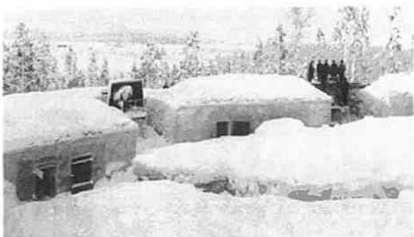
Kanonstandene for festningskanonene og dekningsrommene var for oppbevaring av ammunisjon i tillegg til å gi ly til mannskapene under kampene.