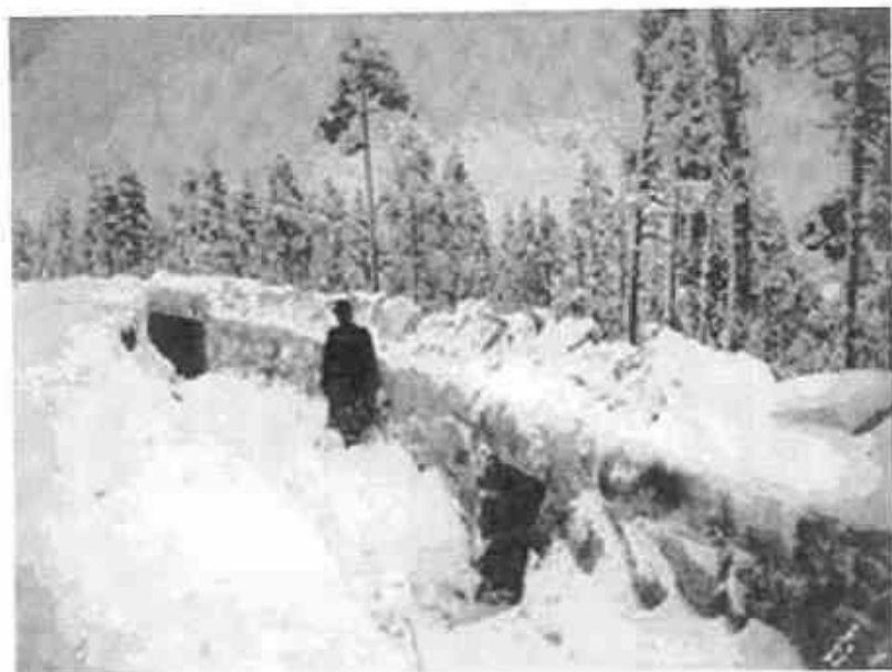
Bildet viser skyttergraven på Urskog fort. Det er lagt opp stein til skyteskår og det går en underjordisk gang ut til kaponierbygningen i fronten.