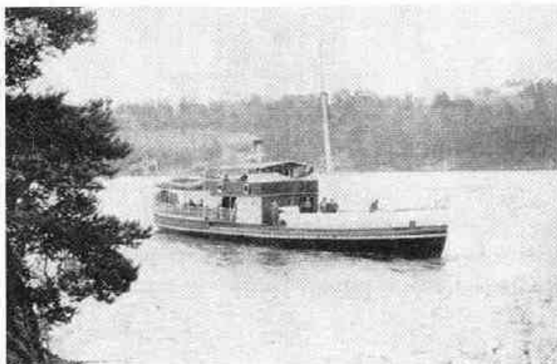
Dampskipet "Strømmen" ved utløpet av Preståa, med gården Torshov i bakgrunnen.

Dersom Norge hadde vært et rikere land i 1905, er det høyst sannsynlig at Øyeren ville ha fått en egen mini-flåte med kanonbåter. Av økonomiske årsaker måtte planene imidlertid reduseres til å gjelde en viss bevæpning av de sivile dampfartøyene som allerede fantes på sjøen. Befestningskomiteens forslag om armering av slepebåtene på Øyeren rakk imidlertid aldri å bli realisert før det hele var over i 1905.