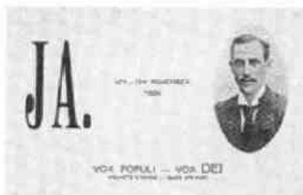
Postkort fra 1905 med bilde av prins Carl og et tydelig budskap om å stemme Ja til kongedømme.

I korthet var de viktigste punktene følgende: Det skulle være en demilitarisert sone på begge sider av grensen helt opp til 61. breddegrad, noe som betød at de nybygde norske grensefestningene måtte rives. Norge hadde imidlertid forhandlet seg til å beholde de historiske delene av festningsanleggene på Fredriksten og Kongsvinger. Begge parter aksepterte å la fremtidige tvister mellom de to land avgjøres av en internasjonal domstol. Forliket var kontroversielt i Norge, men ble tilslutt godkjent av Stortinget med 101 mot 16 stemmer. Riksdagen vedtok på sin side Karlstadforliket uten votering den 13. oktober. Med dette var alle hindre ryddet av veien for en korrekt oppløsning av unionen mellom Norge og Sverige. Den 16. oktober vedtok Riksdagen å anerkjenne Norge som selvstendig stat og den 26. oktober ble Karlstadforliket undertegnet. Samme dag frasa Oscar II seg høytidelig Norges trone.