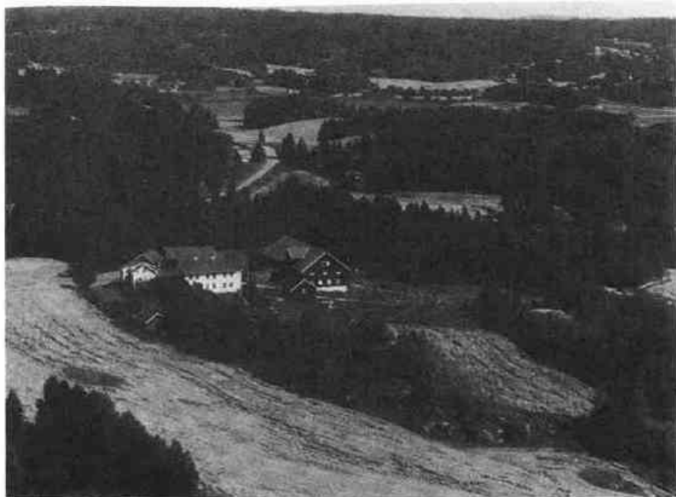
Flyfoto av Ubberud