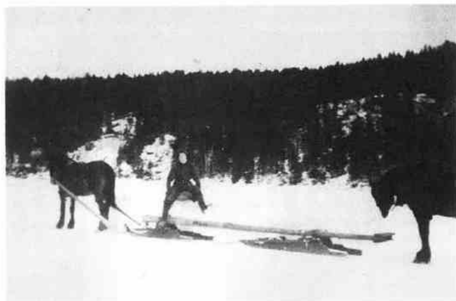
Tømmerdøning - geit og bukk. Her brukt til iskjøring på Mjær (ca.1942)