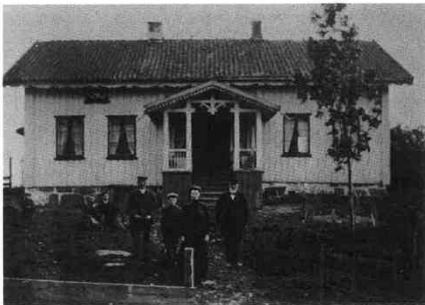
Østre Guslund, dit Anna gikk og handlet som barn