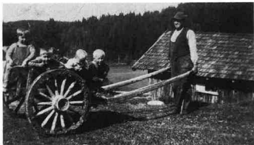
Dette er kanskje motsatsen - gjødselkjerra. Bildet er tatt på Sulerud