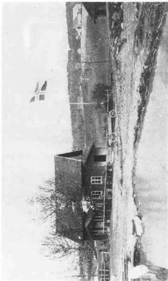
Dette bildet er tatt på Killerud i Daleferdingen i 1920-årene. I bakgrunnen ligger Bøler-gårdene. Og på tunet kan vi se en stivvogn.