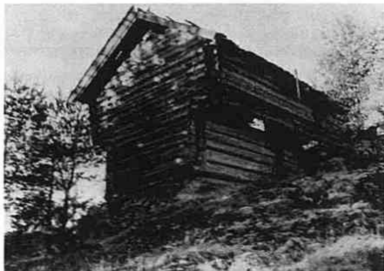
Tjona i Åsen ved Orderud