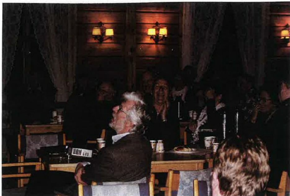
Det var stor stemning og mye latter blant de fremmøtte.

«Ignarbakke» var et sentralt sted i oppveksten. Det hele ble avsluttet med et bilde av Prestegården, sett med dagens øyne. Forsamlingen ga deretter en stor applaus til en meget dyktig foredragsholder.