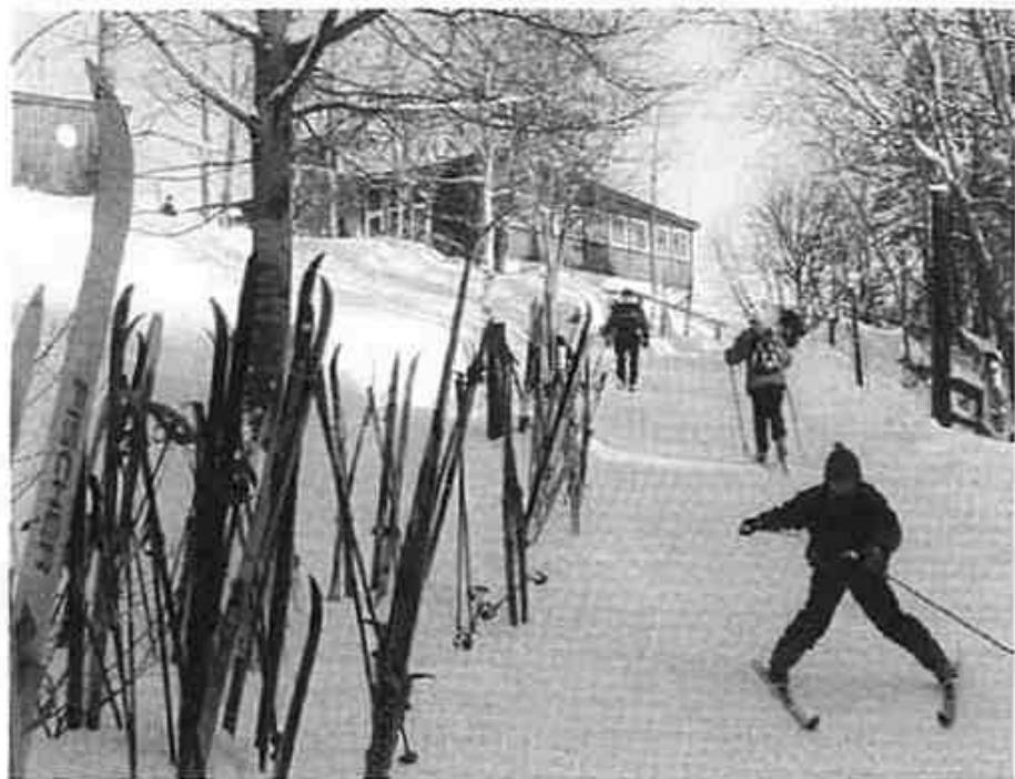
Liv og røre på Vangen skistue.

I 1969 kjøpte Driv sin første snøscooter og man begynte straks å kjøre løyper i området omkring Holmetjern og videre i retning Ekebergdalen. Løyper ble det også kjørt i skogen omkring Vikstjern. I 1970 ble skigruppa i Driv etablert og lysløypa ved Drivplassen ble utvidet både i 1972 og i 1990. Lysløyper fikk man etterhvert også ved Streifinn på Flateby og ved Lotterud i Kirkebygda. Byggingen av det nye klubbhuset og lysløypa på Kjepperud i Ytterbygda førte til at de fleste vinteraktivitetene ble flyttet fra området omkring folkets hus og opp til Drivplassen.