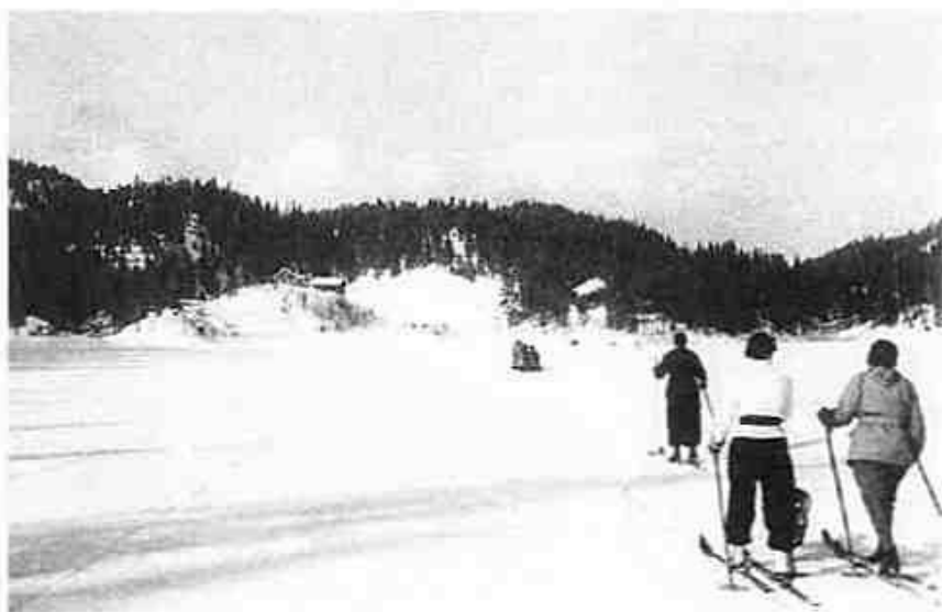
Skitur på Børtervanna i 1930-årene. I bakgrunnen skimter man plassen Bøvelstad.

Kelleristninger viser riktignok at ski ble brukt som framkomstmiddel her til lands allerede for 4000 år siden, men det var morgedølen Sondre Norheim (1825-1897) som knyttet skiene til uvørne vågestykker, lek og moro. Nettopp derfor mener mange at Sondre Norheim er "den moderne skisportens far". Dette skjedde på omtrent samme tid som skiene var i ferd med å miste sin opprinnelige verdi som framkomstmiddel. Man kan kanskje si at den moderne skisportens vugge stod i Morgedal - på den vesle husmannsplassen Øverbø i Nordbygda. Her bodde Sondre Norheim på knappe 15 kvadratmeter med kone og seks barn. Fra Morgedal og Norge har skisporten deretter spredd seg til hele verden.