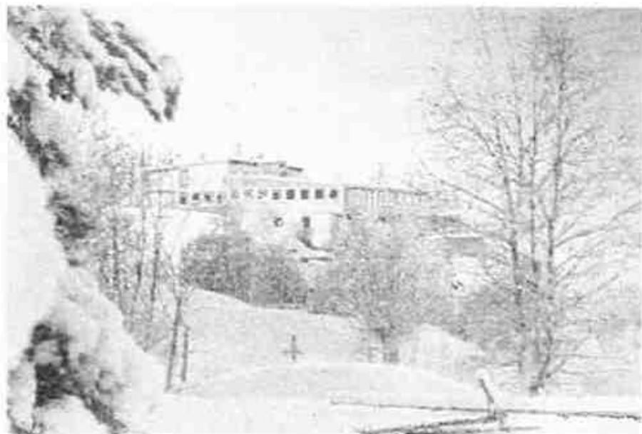
Vangen skistue fotografert en vinterdag i 1961. Foto: Skiforeningen.

Etterhvert som økonomien bedret seg utover på 1950-tallet ble det stadig mer vanlig for enebakkingene å tilbringe søndagen på skitur i skogen. Da Skiforeningens storstue på Vangen i Rausjømarka åpnet i februar 1961, var dette en milepæl for Østmarka som turområde og kort tid etter dukket de første scooterpreparerte løypene innenfor vår egen kommunegrense opp. Det ble i denne perioden også ryddet nye løypetraseer hele veien til Ytterbygda og Drivplassen.