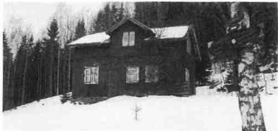
Det er ikke lenger servering på Kalabånn.