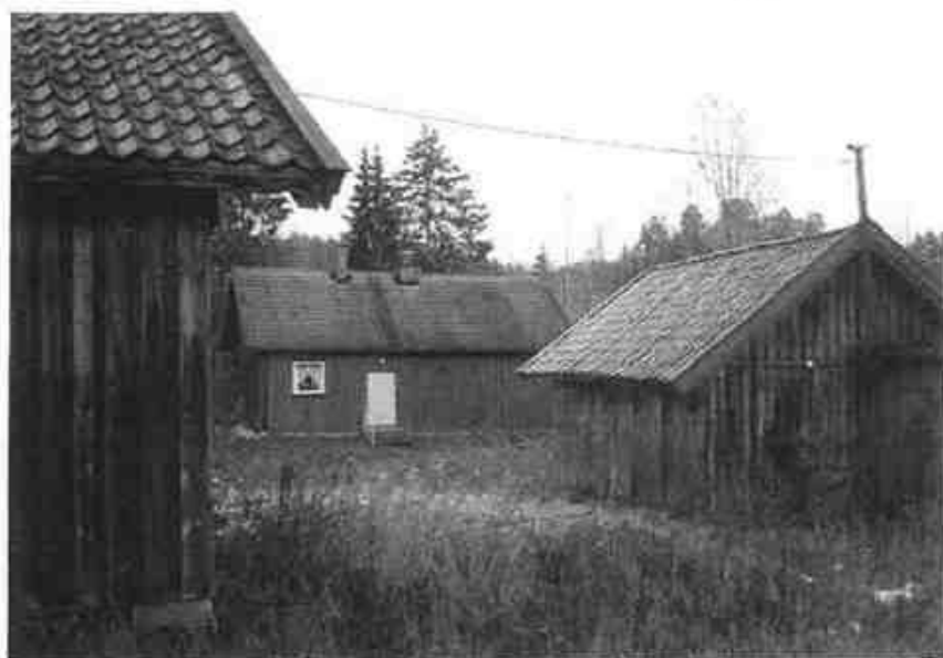
Husmannsplassen Kvernstua i Ytterbygda.

Kulturminneverngruppa i Enebakk historielag har det siste året arbeidet målrettet for å sikre fremtiden for husmannsplassen Kvernstua i Ytterbygda og dette arbeidet ser nå ut til å bære frukter. I kommunestyremøtet 23. mars ble Kvernstua og et større område omkring plassen vedtatt regulert til bevaring. Dette vedtaket er svært gledelig og åpner en rekke nye muligheter for å ta i bruk den gamle plassen på en konstruktiv måte til glede for bygdas befolkning.