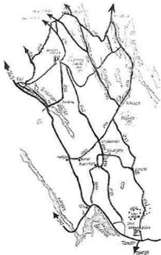
Skiforeningens løypekart fra 1981.