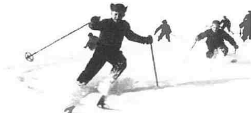
Skilek i Enebakk.