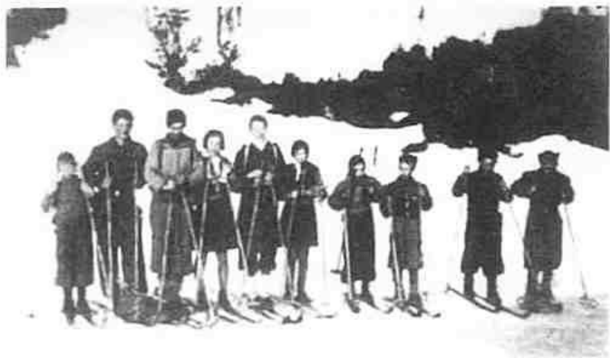
Barn på skitur.