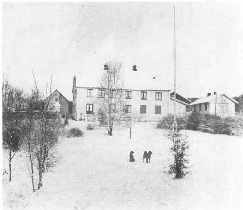
Bjerke gård i Ytre Enebakk i vinterskrud