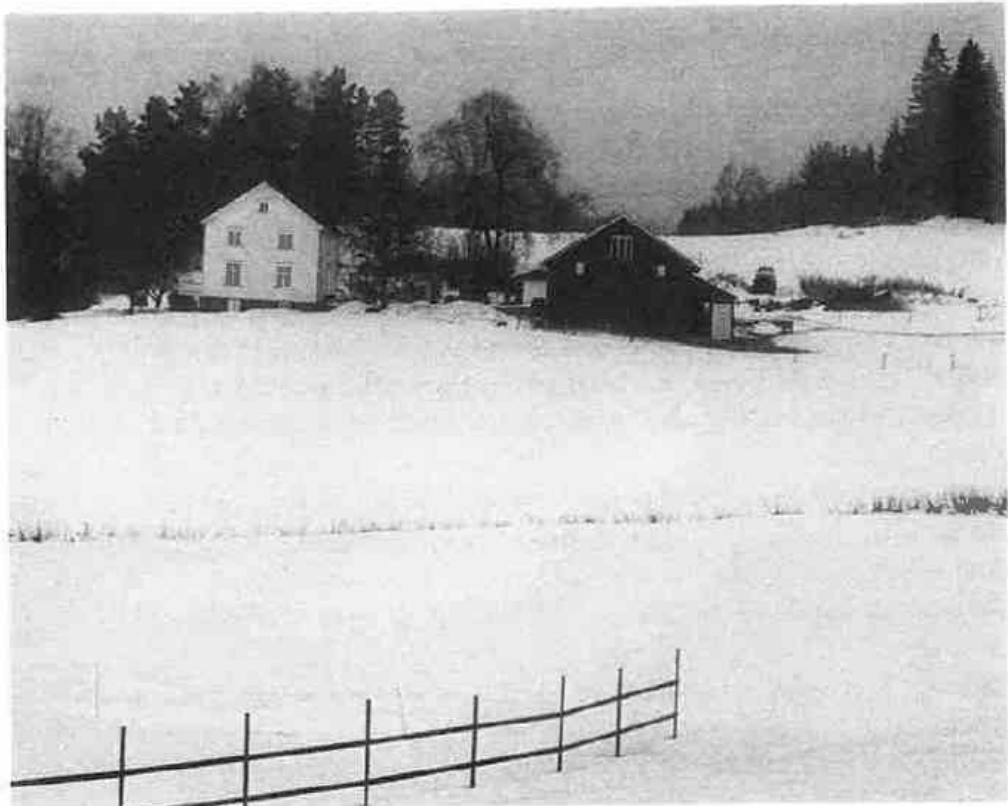
Hamborg i dag

"En større elv" ville vi nok ikkje sagt i dag. Det er ikkje få framande som har stogga bilen i krysset ved Tangenbrua og spurt etter vegen til Tangen bru. Dei har vel sett for seg noko slikt som Minnesundbrua. Men i Ytre Enebakk som så mange andre stader ligg sentrum nettopp ved elva. Før dampmaskina og den nymotens elektrisiteten kom, var det vasshjul som var drivkrafta for alt som heitte maskiner. Ikkje større enn Tangenelva er, har ho godt over tjue meter fall mellom Våg og Mjær, og det skulle ikkje meir enn tre meter fall til for å setje opp eit stort vasshjul.