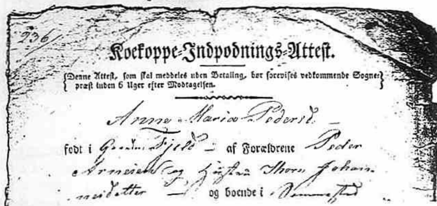
Faksimile av en "Koekoppe-Indpodnings-Attest" fra 1826

”Helse og sundhet i Enebakk på 1800-tallet”