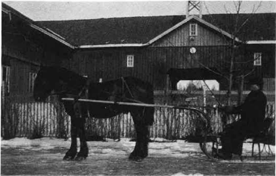
Dette bildet fra Bjerke er tatt i 1912.

ikke det norske folket noe vondt. De tyske vaktene kom med korte mellomrom inn til meg om natten og inspiserte. Ut på morgenkvisten, ved firetiden, kom to offiserer inn og kommanderte den norske sjåføren opp med voldsom røst. De to tyske soldatene sprang da også opp. Ved denne tiden var det allerede oppbrudd og soldatene begynte å dra videre.