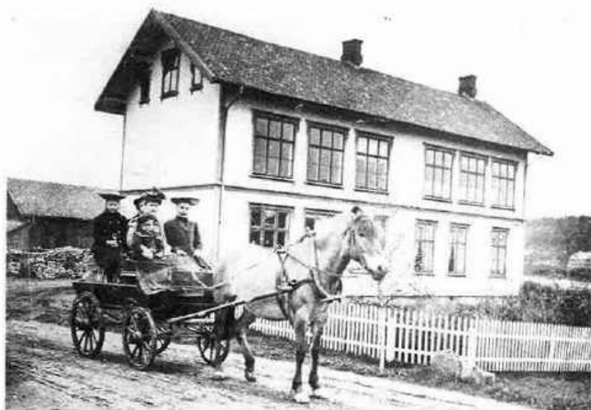
Hest og vogn ved Ytre Enebakk skole