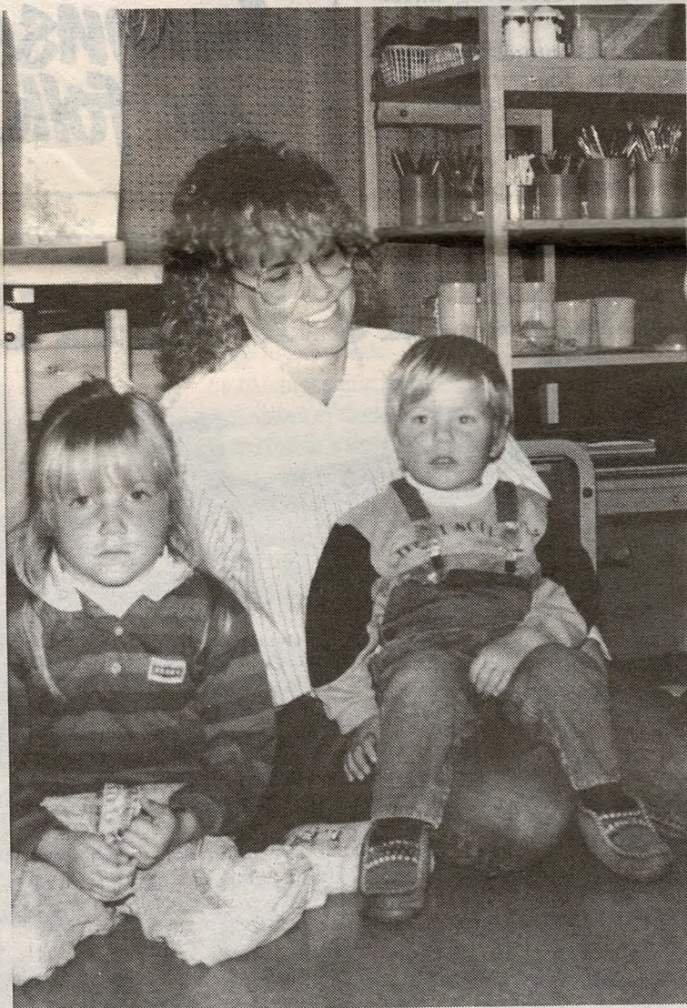
Flere barn skal få plass i kommunal barnehage. Dette vedtok kommunestyret mandag mot en stemme. Kirkebygden barnehage, som er den eneste med 0 - 3 tilbud blir foreløpig ikke berørt av vedtaket.