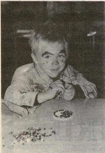
Nabbi-perler er alltid like moro. Især for de minste.

Husmorlaget har også ved tidligere Barnas Dag, solgt FORUT varer. Det gjelder også Ytre Enebakk Husmorlag som hadde egen avdeling med disse varene på fjorårets familiedag.