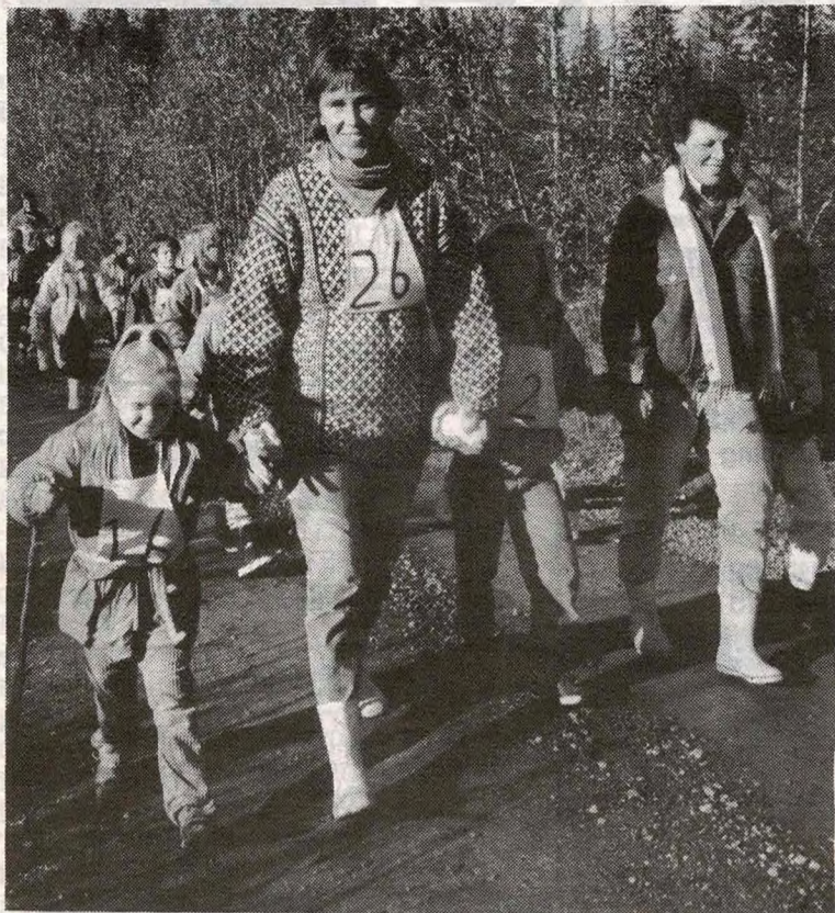
Marsjdeltagere fra klasse 2a i godt humør på veien fra Gjeddevann. Vel tilbake på skolen fikk alle utdelt diplom.

På Hauglia skole har de i mange år hatt en tradisjonell markering av FN-dagen. Men i år ville de prøve en ny vri. Det ble sist fredag arrangert en skolemarsj, og foreldre og foresatte var invitert til å bli med. Inntekten skulle gå til årets TV-aksjon.