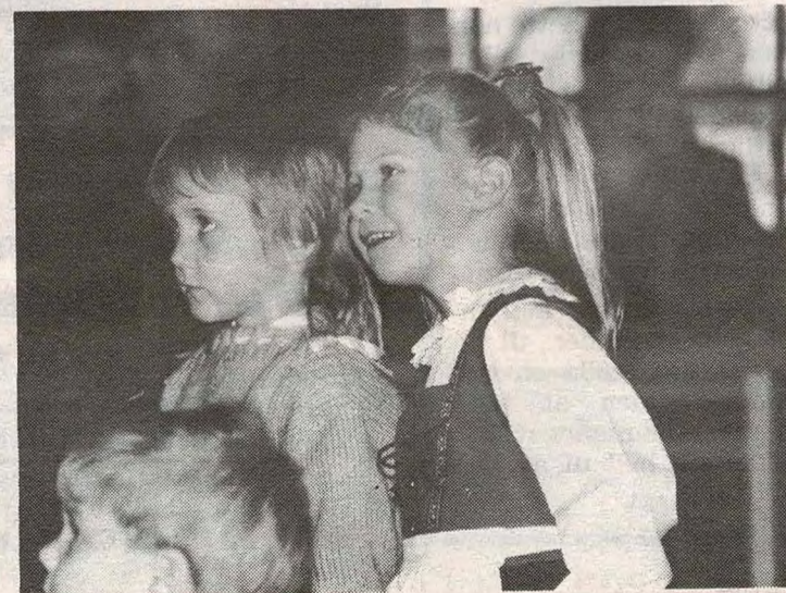
Ungene strålte omkapp med juletreet.

En fin fest, som understreket at Kirkebygden Vel, også tenker på de yngste.