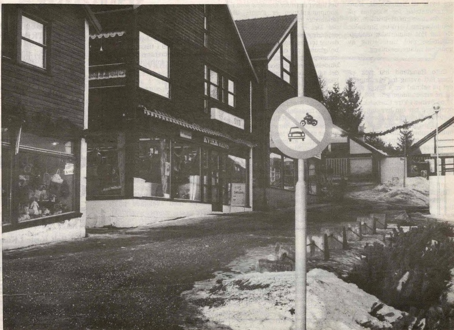
I over tre år har næringsdrivende på Flatebysenteret ventet på at dette skiltet skal bli godkjent slik at man

– Selv om skiltplanen ikke er stadfestet, må man kunne si at den som kjører inne på området