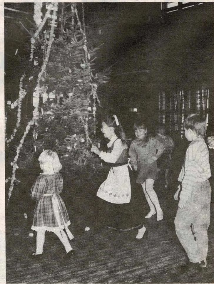
Stor stemning på Kirkebygden Vels juletreffest 4. juledag.