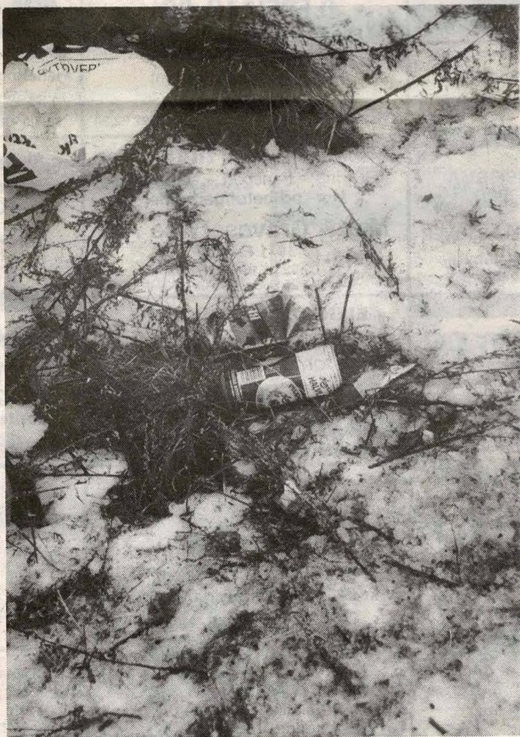
Plastposer og tomme ølbokser fløt over alt i «Krysset» 1. nyttårsdag.