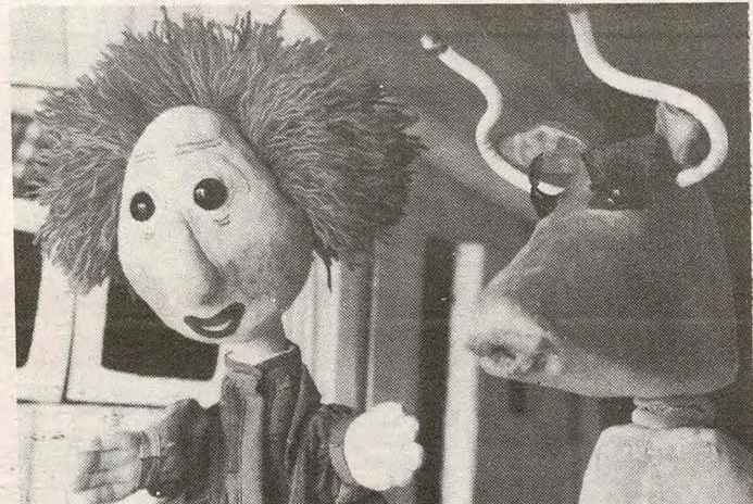
Herr Fuglesang og Himmelkua.

Førstkommende søndag ettermiddag inviterer Enebakk menighet til dukketeater på Hauglia skole på Flateby. Denne gang er det Flateby-beboernes tur til å møte den etter hvert så berømte Himmelkua til Ballongteateret. God fornøyelse.