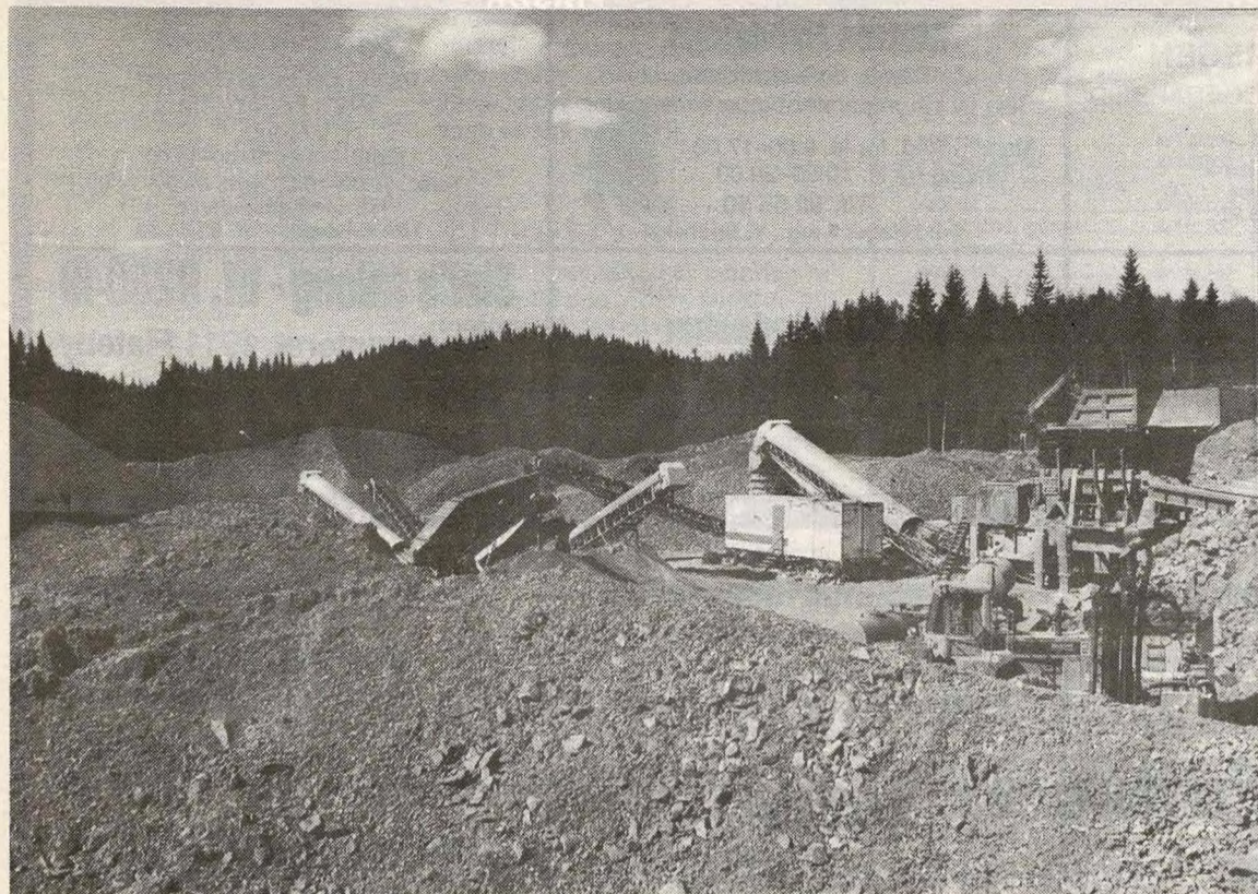
Pukkhaugen vokser stadig ved Streifinn. Mellom 1500-2000 tonn knuses daglig - uten at driften går etter forskriftene.