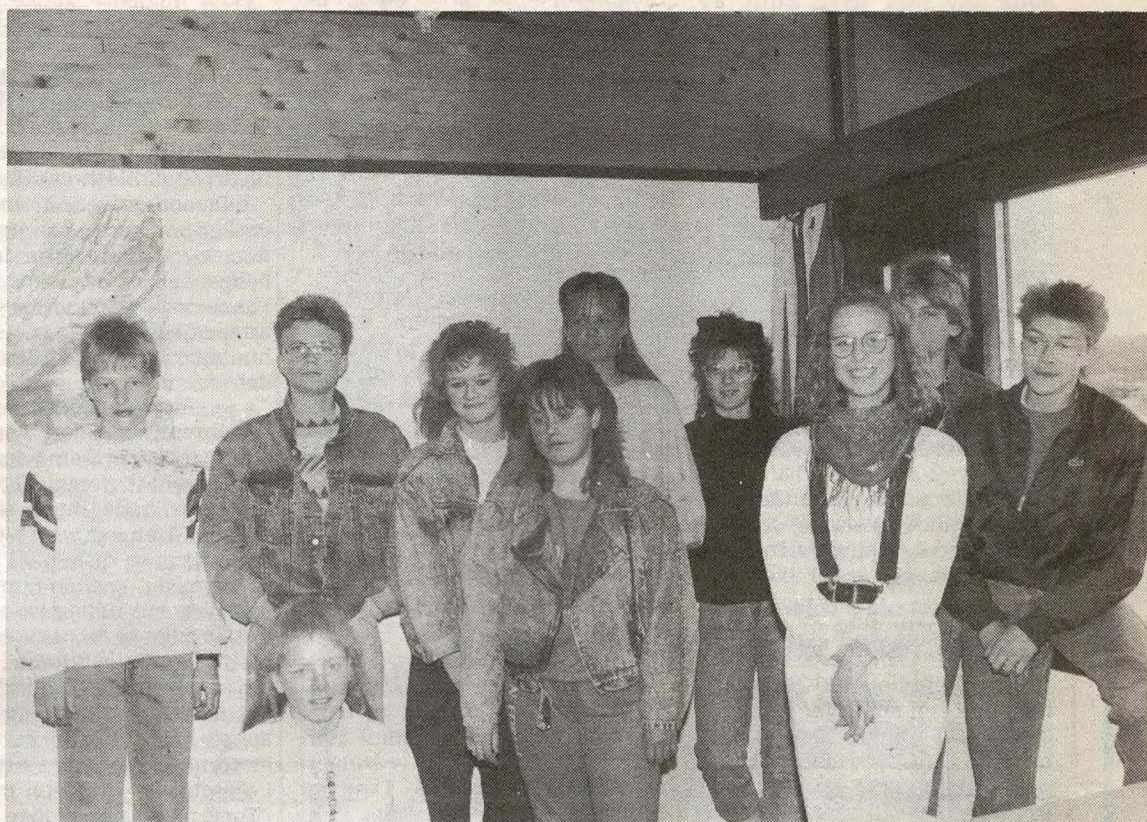
Her er gjengen som forsøker å fortelle oss noe om seg selv, og om hvordan de opplever den verden de er i ferd med å bli voksne i.

Neste gang det oppstår en konflikt hjemme, burde dere kanskje se tingene litt fra vår side også? Det er viktig at en ungdom får mye forståelse og ros, og ikke bare hører at slik og slik skal det være. Lykke til.