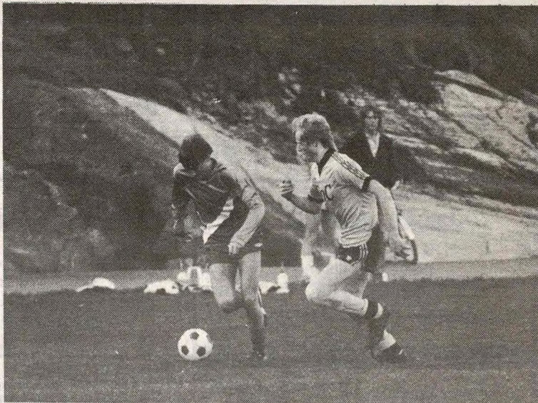
Driv spilte en god kamp mot Oshaug

Sesongens første A-kamp på den nye Mjærbanen endte med seier til Driv. Driv spilte lett teknisk fotball og vant til slutt 4 - 1 over Oshaug.