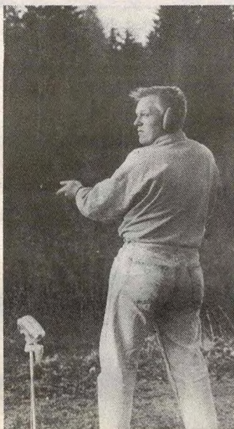
Trening foran helgens leir- duestevne. Det var stor akti- vititet da Vignett forleden be- søkte foreningens anlegg på Durud.

Vignett kommer tilbake med fyldig omtale av jubilan-ten i et senere nummer. Fore-løpig ønskes jubilan-ten til-lykke med feiringen, og med