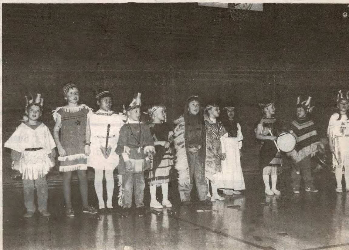
Flotte indianere fra musikkskolen på Vik

Nok en suksessrik familiedag i Ytre Enebakk Husmorlags regi. Hele Ytre Enebakk skole sydet og kokte av aktiviteter lørdag formiddag. Overalt foregikk det noe. Formingsaktiviteter, vaffelsteking, reflekspøysing. Og sist men ikke minst, innledningsvis masse fin underholdning av lokale krefter.