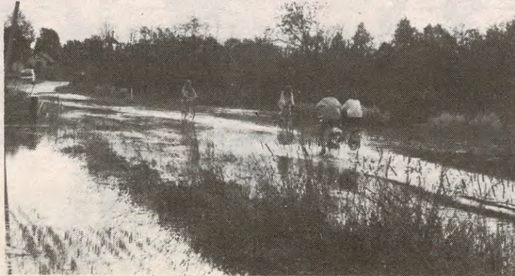
Kloakkering av Ekebergdalen ut. Mer forurensing- og mer flom.....

Tilsammen fører de planlagte investeringer i 89-91 til et samlet investeringsnivå på 32,5 millioner, som vesentlig skal finansieres med lån og tilskudd, samt egenkapital. Driftskonsekvensene eks. avdrag på lån blir på 220.000 kroner i 90 og 940.000 kroner i 91. På driftssiden er bl. annet igangsetting av Kirkebygden