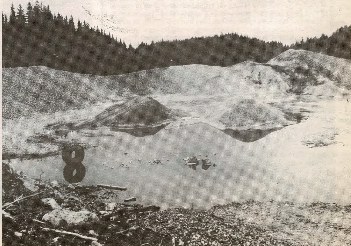
Det har vært mange hull å putte pengene i. Lenge skal det også gå før det blir idrettsanlegg i det utgravde området ved Streifinn. Anlegget er tatt helt ut av langtidsbudsjettet.

Dette begrunnes med at man med de nye lokalitetene kan oppnå en mer rasjonell drift. Fra 1.1.88 overtar kommunen ansvaret for driften av Enebakk Syke og Aldershjem. Fra da av skal pasientene betale for opphold til kommunen. Dessuten tilføres tilskudd til driften gjennom rammetilskuddet. Muligens kommer man ut i balanse her, men usikkerhetsmomentet er inntekten av egenandelene som i utgangspunktet er beregnet til 800.000 kroner. Her kan det bli inntektssvikt eller merinntekt.