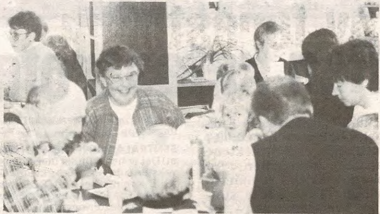
Store og små koser seg med deilig mat.

Dette kunne barna i Ytre Enebakk barnehage juble, tirsdag tredje november. De hadde laget istand til stort bursdagslag, med mange gjester.