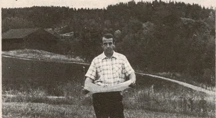
Nei til samfunnshus i Ytre Enebakk

Lista representerer tilsammen ca 100.000 i foreliggende planer, og planleggingen av noen av de største prosjektene har i 87 kostet kommunen mellom 300.000 og 500.000 kroner.