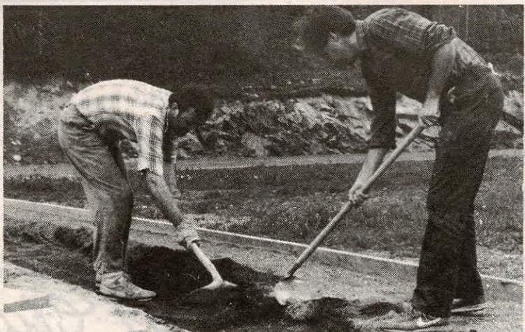
Mer dugnad for foreninger og lag. Posten for tilskudd til drift og vedlikehold av anlegg er sterkt redusert. Her fra rehabilitering og opprusting av Mjærbanen. Laget ønsker sterkere kommunalt engasjement i vedlikehold av anlegget. De må nok basere seg på nye år med dugnad.