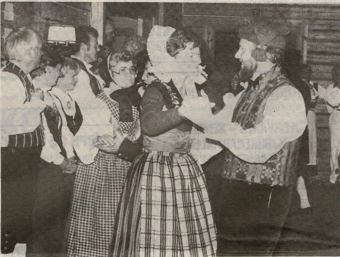
Det var presisjon og stil over danskenes oppvisning.

Lørdag kveld var det duket til stor fest på Ignarbakke. Flere lag fra omegnen var også invitert. Grupper fra Nannestad, Sarpsborg, Ås, Lillestrøm, Lørenskog m.fl. Musikken ble besørget av hele fem spillemannslag. Foruten Ignars egen gruppe Slihjul og Sug, hørte vi Fresk Luft fra Enebakk, Flatlusa fra NHL, Ås, Nannestad Spillemannslag, og Toradergruppa fra Steinsgårds Kroen. Reinlen-