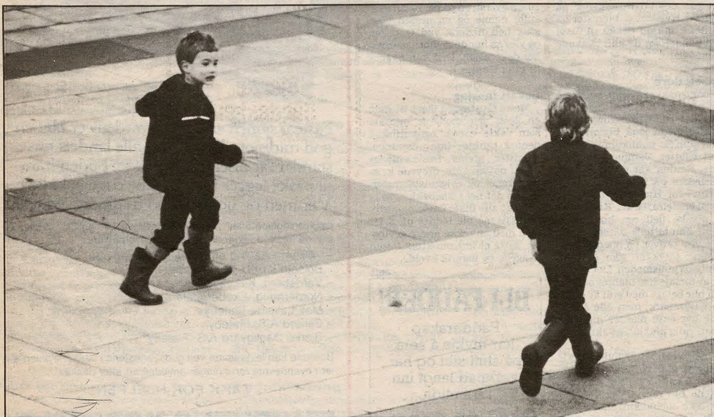
Vi begynner så smått å vente på våren, det skal bli godt å kjenne noe annet enn snø under beina igjen...