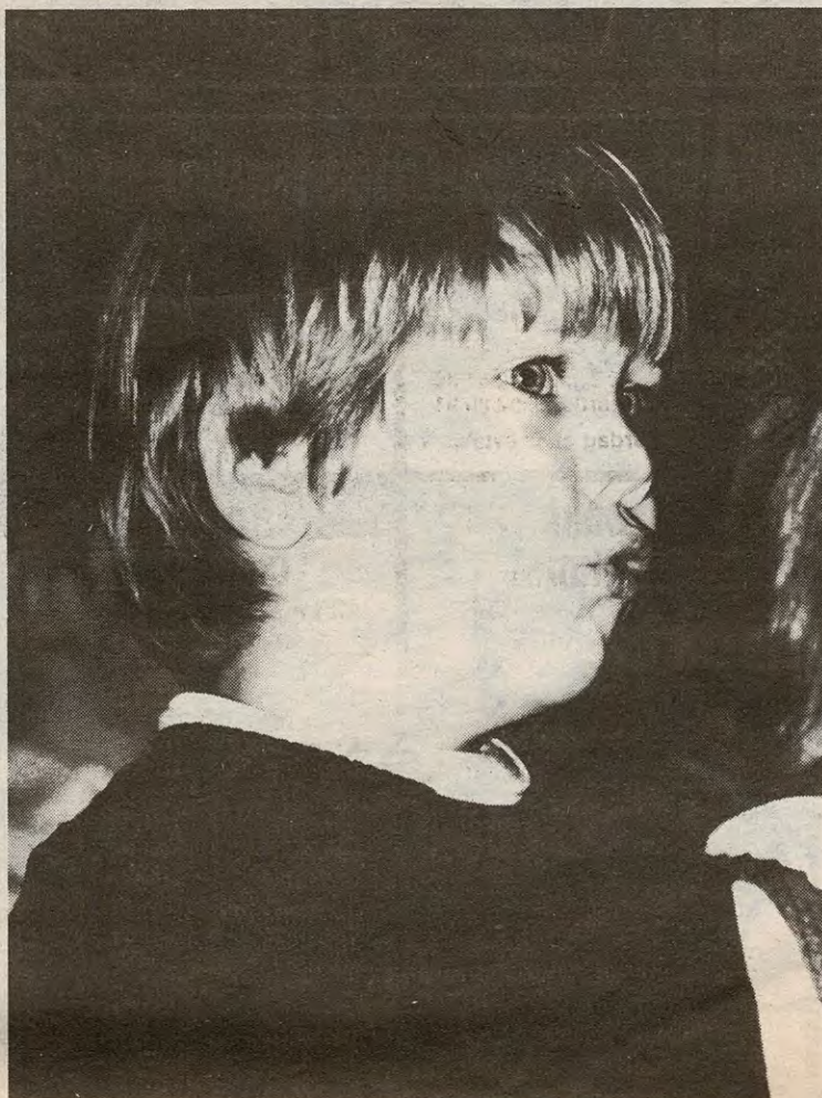
Ytre Enebakk Barnekor imponerte stort under konserten og konsentrasjonen var helt på topp, i alle fall hos denne karen.

Barnekolet fra Ytre Enebakk imponerte også stort, og det samme gjorde Emaus-musikken.