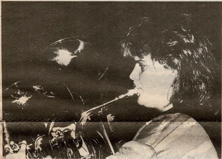
En av blåserne i Enebakk Skolekorps, tydeligvis meget konsentrert om oppgaven.