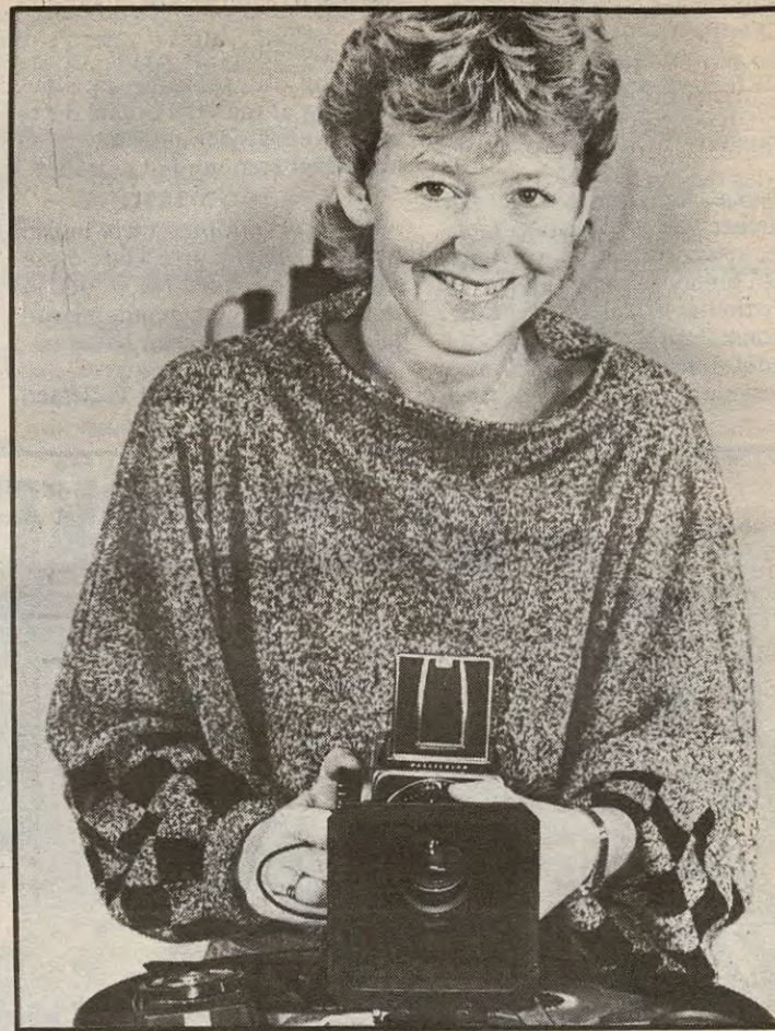
Smil til fotografen, og fotografen smiler igjen.

Det er jo klart at en såvidt liten forretning ikke kan sitte inne med et stort varelager, men du kan regne med at det hun ikke har på lager, kan skaffes i løpet av et par dager.