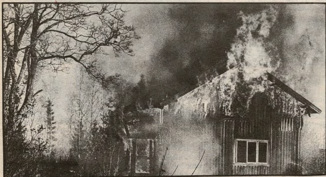
Gamle Skaug gård på Flateby ble nylig brent. Gården forfalt, og eieren ønsket at brannvesenet skulle brenne den.