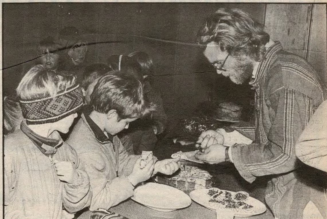
Kaker og saft fikk Kirkebygden barneskole inn mye penger på.

Grendesenteret - 1911 FLATEBY Tlf. 92 87 21