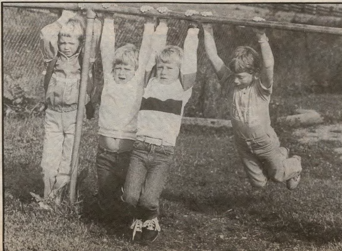
Ikke lett å få fri for elevene, her representert ved noen 1. klassinger fra Kirkebygda.

For de som har hatt inntrykk av det er svært så enkelt å få fri fra skolen, vil skolestyrets nye retningslinjer i alle prøve å begrense dette noe.