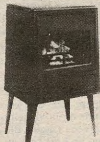
KAMINPEIS NR. 108D