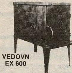
VEDOVN EX 600