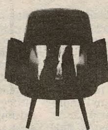
OVNSPEIS NR. 105