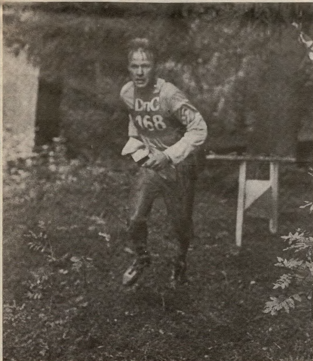
Siste post unnagjort, til mål snarest.

bakk som har orientering på programmet, de som bor på Flateby trener og løper for Rælingen OK. Denne klubben er atskillig større enn driv når det gjelder antall utøvere, men likevel er det synd at utøverne må reise ut av bygda for å få trene en idrett som er såpass stor på landsbasis.