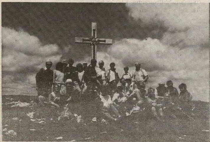
På toppen av «Scheealm»!

Turen til Østerrike gikk som sagt med buss, reiseruta gikk via Gøteborg, Frederikshavn, Danmark og gjennom