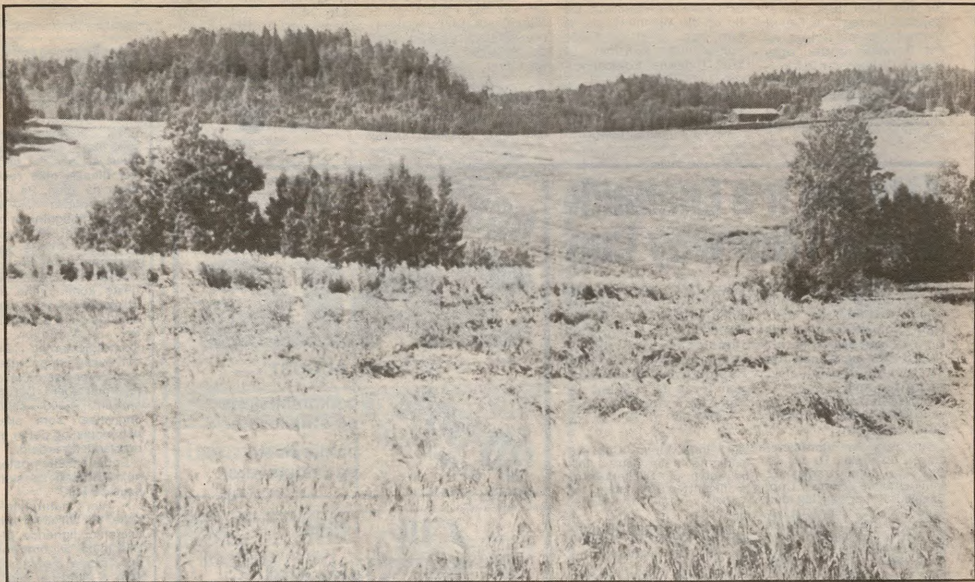
Mye legde, spesielt på bygg.