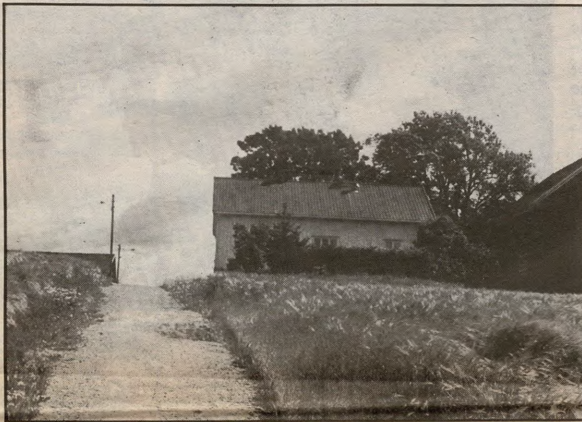
Også prestegården er rammet.

Tar man en kikk på de mange åkrene rundt omkring i kommunen, vil man fort finne ut at værgudene har fart ganske hardt med årets grøde. Mange steder er det meget stor legde (korn som er lagt ned av uværet).