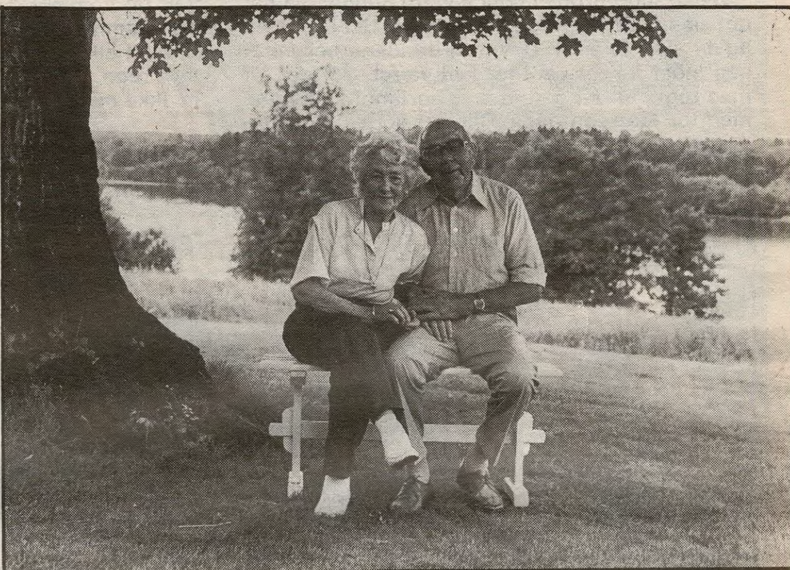
For- og nestformann i pensjonistforeningen.

ningens egne spilte opp til dans på trekkspill og det var åpenbart at folk likte å danse, og det kunne de virkelig til gagns. Valsefoten var nok i orden på de aller fleste, men det kommer kanskje av at de hadde gjort det noen ganger før i livet.