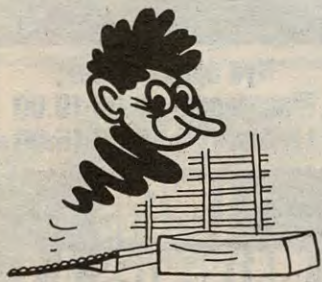
Forover rulle. – En kjent øvelse for de fleste.

Som en artig avslutning på dette showet, ble samtlige publikummere forsøkt tauet ut på banen, og satt i sving med et kvarters kurs i «Gymping». Det var nok fin trim for de fleste. Vi observerte i alle fall «breikegruppa» City crew på vei ut av banen etter endt dyst, med tunga nok så langt ute.