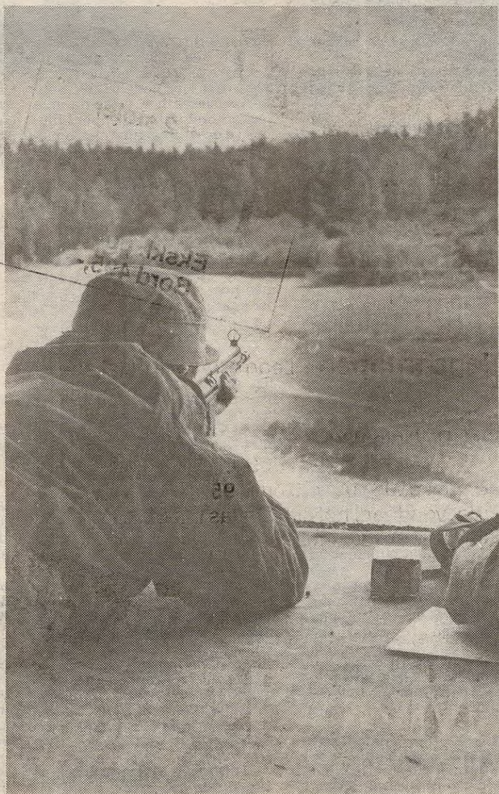
Blink – eller bom? Skyteøvelser er viktig på en HV-manøver.

ildkraft, og bakken ristet ganske merkbart når det ble avfyrt, og for ikke å snakke om hvilken virkning drønnet hadde på ømtålelige journalistører – effektivt uten tvil. Natt til fredag ble den avsluttende nattmanøveren avholdt. Dette skal være en mobiliseringsøvelse som går ut på at avdelingen gjør som om det skulle ha brutt ut krig.