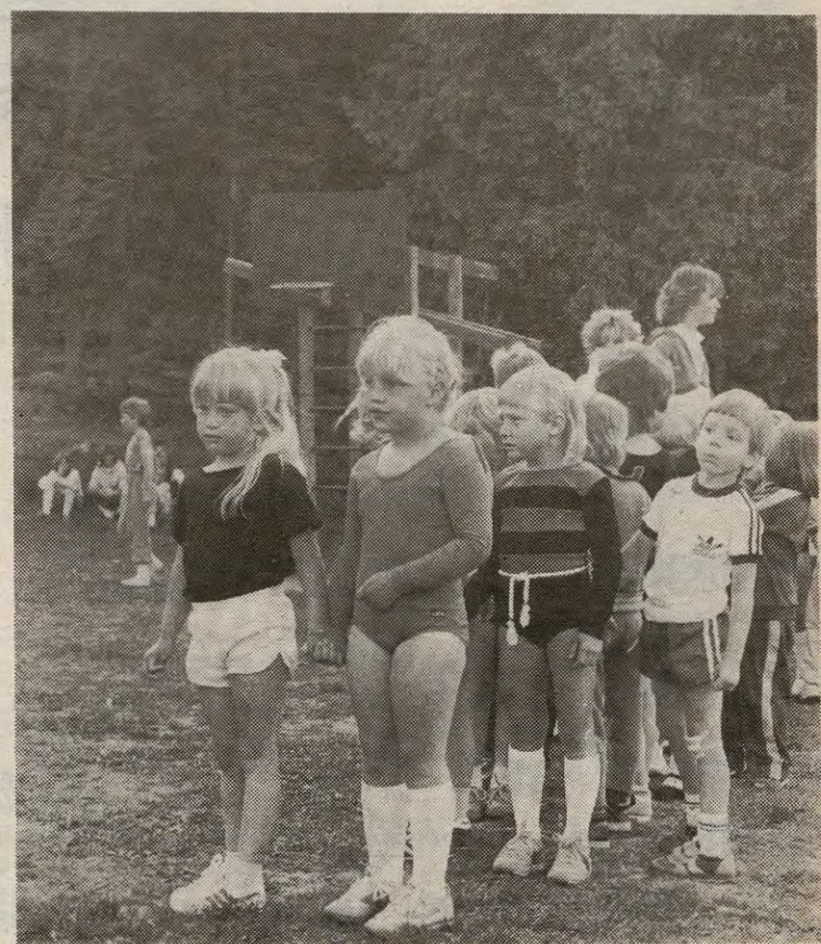
Er det vår tur nå...eller?...