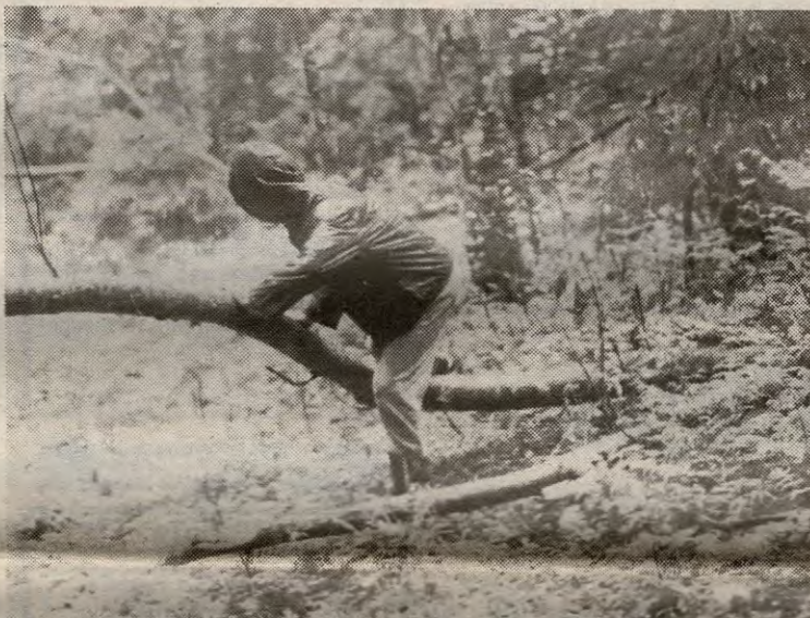
En ensom liten en på vei mot mål inne ved Rausjø. Kliss våt og frossen, men med ny rekord.

En fuktig fornøyelse var det for de 132 startende i årets plankemarsj. Regnet silte jevnt ned, og støvlene ble etterhvert godt oppfylt med vann, men pytt - hva gjør nå det bare man kommer fram.