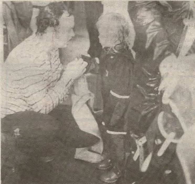
«Pappa, jeg er bløt, også er det så kaldt». Denne lille piken var vel plankemarsjens aller yngste deltager. Men til mål kom hun.

- Konklusjonen etter årets plankemarsj (Les: «Plaskemarsj») må bli at selv om ikke værgudene var på arrangørens side, så var den vellykket likevel. Godt over 100 fikk fullført sin tredje marsj og fikk sitt merke som vår før omtalte 10-åring i år kaldte «svømmemerke».