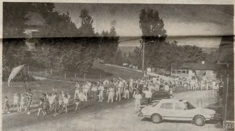
250 turnere + korps + spente foreldre. Det blir et imponerende tog opp Ødegårdsliveien.