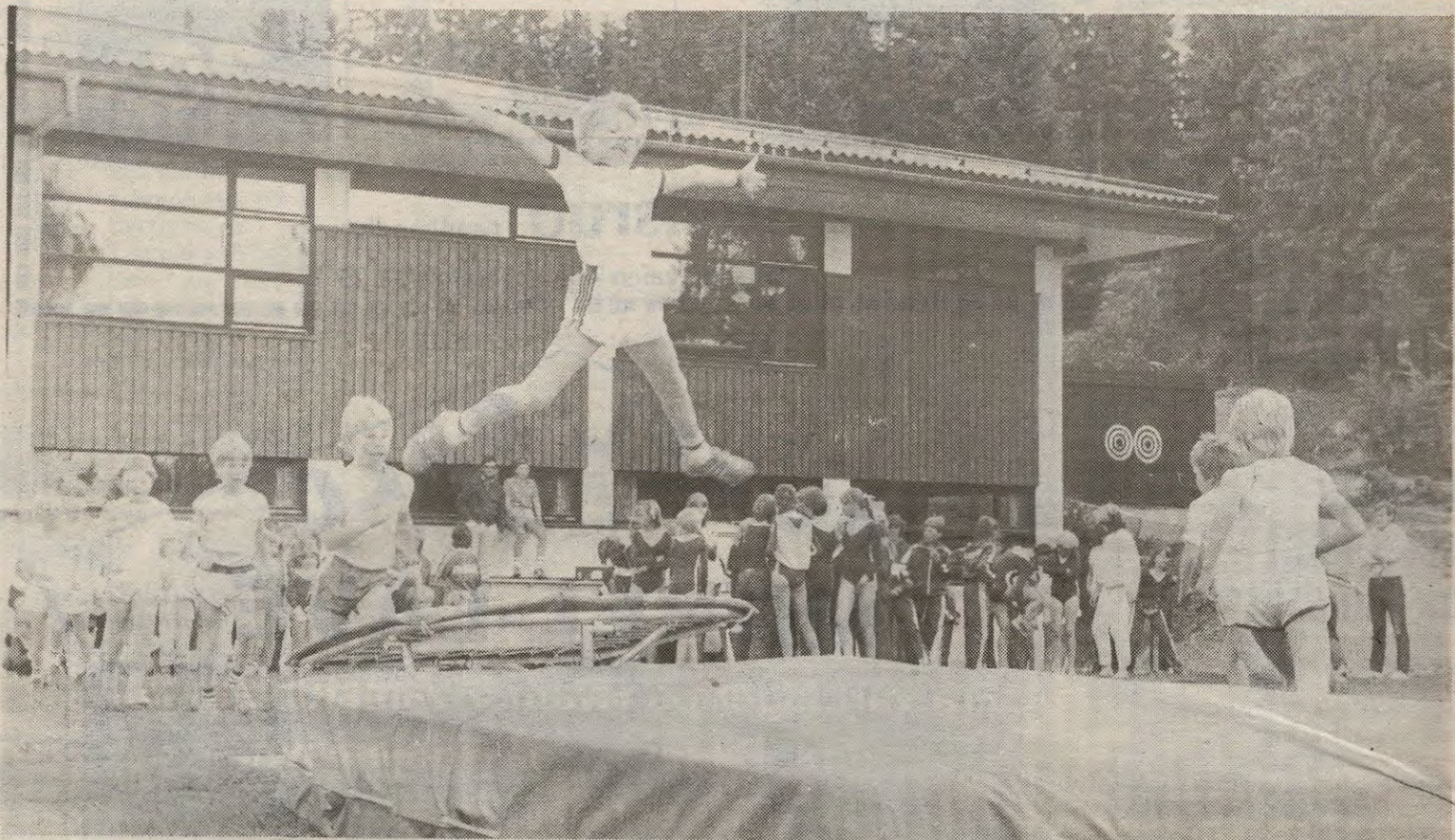
Hui – hvor det går. Drivs yngste gutteturnere turner av hjertens lyst på «tjukkassen».