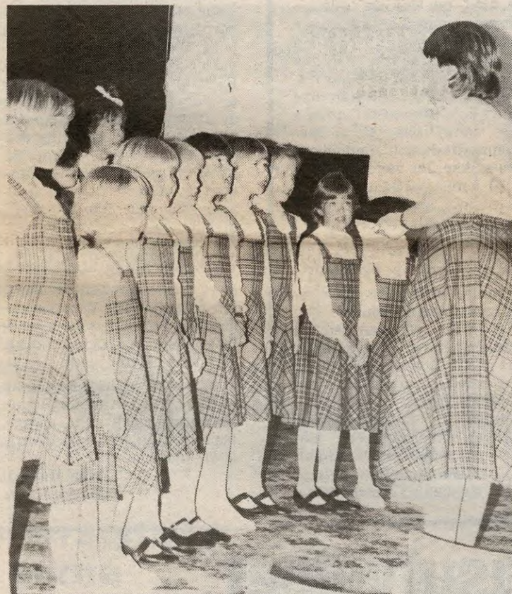
Flateby Barnekor med sjarmerende sang, tok publikum med storm.

Det er bare å beklage at ikke enda flere hadde møtt opp i Kirkebygden lørdag ettermiddag. Og apropos - vi synes det er leit at noen av musikanterne har en tendens til å forlate arrangementet sammen med familien etter endt dyst. Skulle alle gjøre det, blir det tynt i publikumsrekkene for de som står bakerst i programmet. Vår oppfordring er - bli til slutt - få med alt av godbiter enebakks blomstrende sang og musikkliv har å by på.