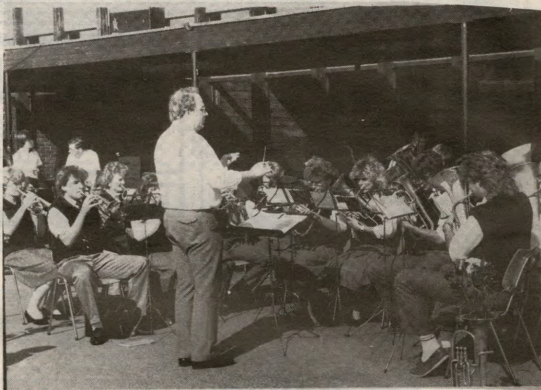
«Betel-korpset» viste som vanlig en høy musikalsk standard.

- Aldri tidligere i Enebakk Sang og Musikkråds historie har det vært så mange store ar-