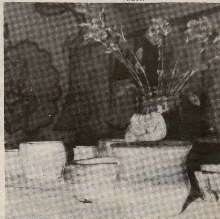
– Imponerende keramikkarbeider. Resultatene virket nesten profesjonelle...