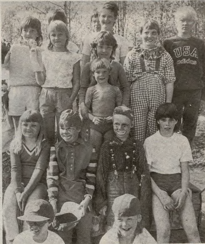
De dyktige sirkusartistene samlet på et brett etter den vellykkede forestillingen.

Vår og sirkus hører sammen, og lørdag ettermiddag var turen kommet til Ytre, nærmere bestemt fotballplassen i Fjellveien. Visste du det ikke? Ikke vi heller før vi ble tilkalt av en blid dame på tråden: - Det er sirkus i Fjellveien.