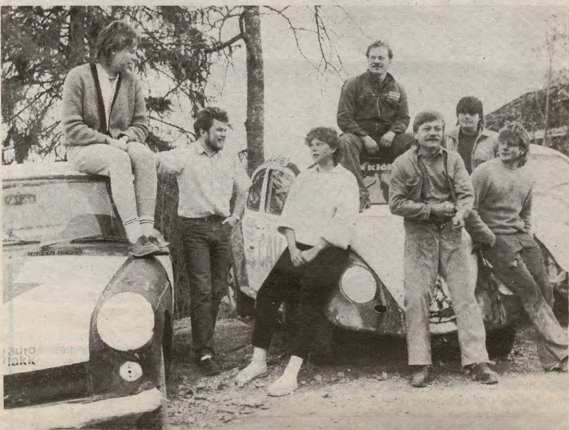
En liten del av bilcrossentusiastene i Ytre samlet på løpsbilene sine.

«mekking» i stor stil. For en uinnvidd, vil det umiddelbart se ut som en bilkirkegård dette, men det er helt feil. Det som ved første øyekast kan se ut som vrak, er løpsbiler for «Monkey team» fra Enebakk. Hele 13 kjørere teller denne gjengen, men det er flere med i miljøet rundt, så 20 mennesker er intet galt tall i dette teamet. Bilcross er som før nevnt en meget spesiell idrett. Lokalpressen har laget et poeng av at det ikke akkurat er pene biler det kjøres med, og med henvisning til en bestemt episode blir bilcrossutøverne beskyldt for å ha funnet sitt viktigste verktøy i slegga og brekkjernet. Det skal som sagt gjøres billigst mulig, men det betyr ikke at det er en hasarddøds idrett.