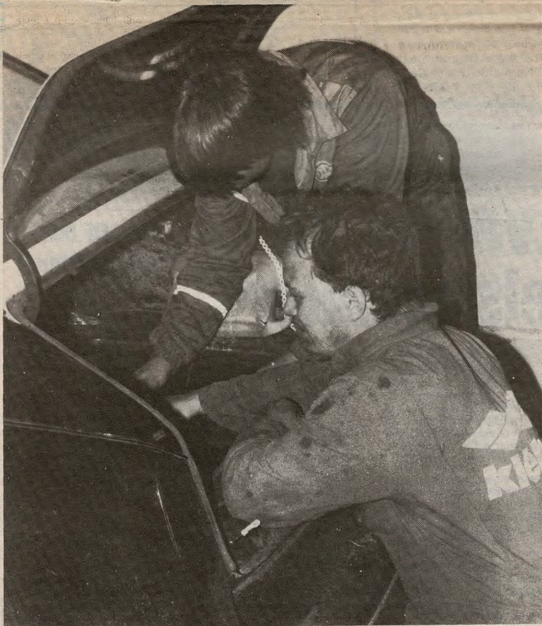
I «Monkey team» samarbeider man om å få løpsbilene i sikker stand før løpene.

Sikkerheten blir alltid satt i høysetet får vi opplyst. Før bilene får lov til å starte i et løp, blir bilene grundig sjekket av kvalifisert personell, og sikkerhetsutstyret som blir brukt viker ikke tilbake for de strengeste sikkerhetskrav. Veltebøyler (godkjente selvsagt), og fire-punkts sikkerhetssele er standard på bilene. Føreren er sikret med flamme/brannsikker dress, hansker og hette, og selvsagt stiller man med hjelm. Disse sikkerhetstiltakene har ført til at det svært, svært sjelden forekommer skader i bilcrossmiljøet. Flere av førerne har gått rundt, og havnet på taket uten andre skader enn en såret stolthet, og den leges fort i det flotte og vennlige miljøet rundt denne sporten.