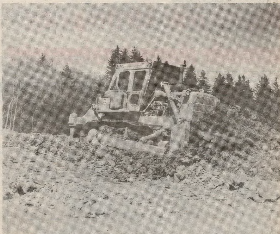
300 hestekrefter tar godt med seg. Her er det den største bulldozeren til Pettersen & Wattum i full sving.

Men det er ikke nok med det. Herredssagronomen foretar oppmåling og til slutt befarings- og godkjenning av det behandlede området. Uten at vi skal fyre opp under lokalsjåvinismen i Enebakk, så kommer vi i alle fall ikke utenom at det tross alt er forskjell på Ytre og resten av bygda – ihvertfall topografisk. Områdene rundt Øyeren, altså