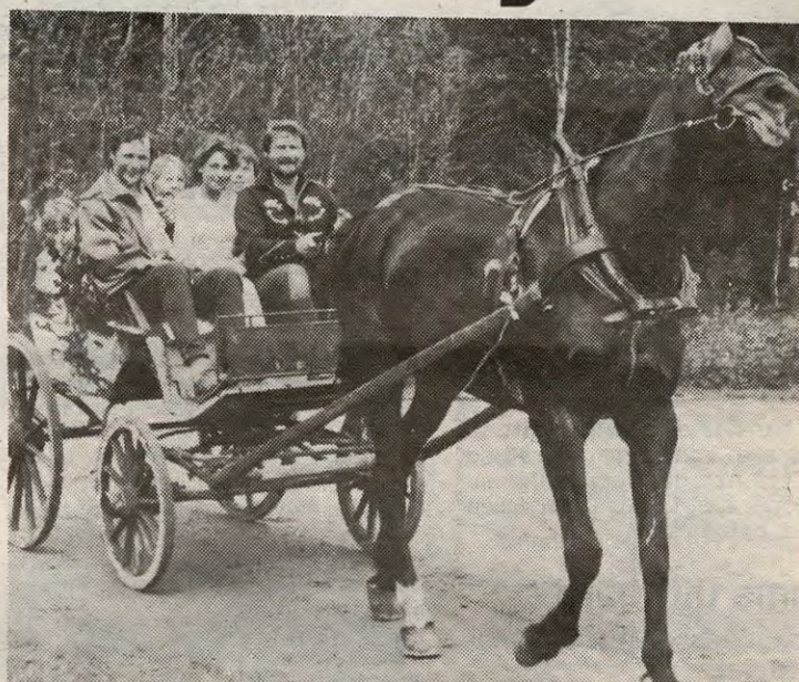
I fjor deltok Handicaplaget for første gang, og hesteklubbene stilte opp med hester og vogner. . . .

Rausjø skole markerer avslutningen på ruta, og her kan man hygge seg med kaffe, va-