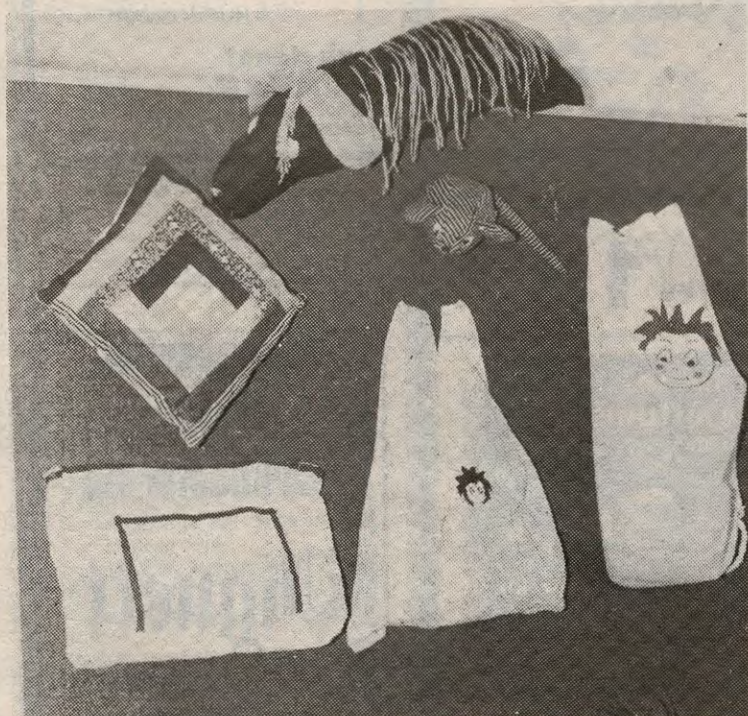
– Lappeteknikk, kosedyr og ryggsekker....