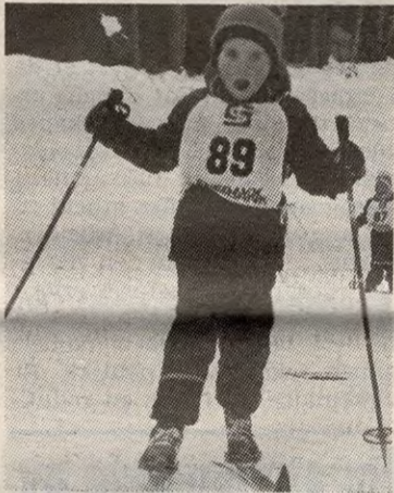
Tunga rett i munnen og full fart mot mål..