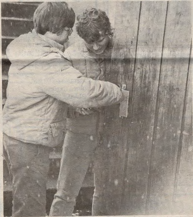
Det var gjennom døra tyvene kom seg inn. Her er to av EMC's medlemmer i full gang med å utbedre skadene.

Enebakk motorklubb er på nytt blitt utsatt for innbrudd. Motorklubben har til alle tider vært et yndet besøkessted for nattlige gjester. Ved flere anledninger har det vært innbrudd på «klubben», uten at det har blitt gjort annet enn å skifte lås. Det har vært snakk om å forsikre verdigjenstandene men det opplegget står etter det vi får opplyst, i stampe. Ved innbruddet, som forøvrig skjedde natt til fredag ble det stjålet en del disco-utstyr. To platespillere, to mikrofoner, en hodetelefon, en munn-til-munn-maske(?), en forsterker, og diverse kontorutstyr, deriblant stempler med Enebakk motorklubs emblem. Tyvene hadde sagt over låsen på inngangsdøra, og dermed kommet seg inn den veien. På fotorommet hadde tyvene plutselig fått trang til å tre av på naturens vegne, og dermed gjort sitt fornødne der og da.