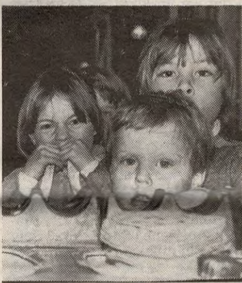
Sultne skiløpere i pølsekø inne på Streifinn.