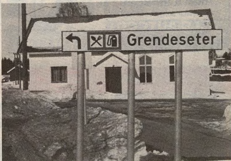
Dette skiltet står like før innkjøringen til Grendeseteret på Flateby. Eller skulle vi kanskje si Grendesetra? Eller hva hr. Veisjef?