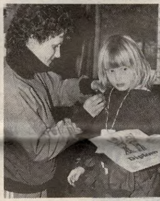
De største, som hadde fulgt skiforeningens opplegg fikk utdelt skimerket..