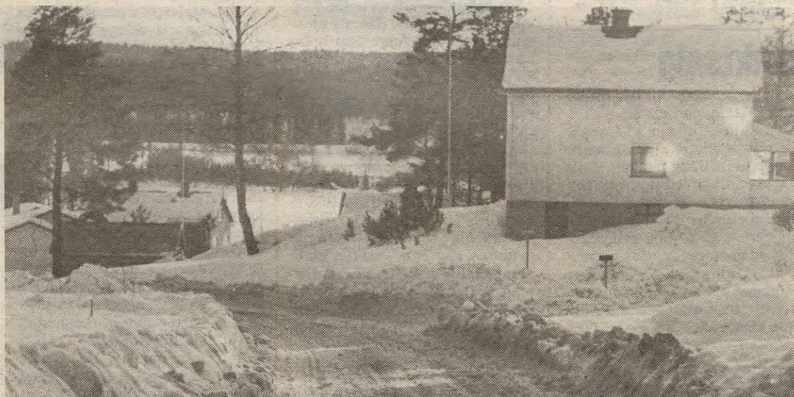
Her skal det bli asfalt til sommeren, men et flertall i kommunestyret vurderer mulighetene for å anlegge fartsdumper samtidig.